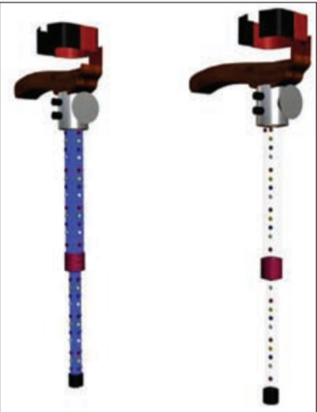
العكاز الإلكتروني للمكفوفين مع كامل ملحقاته