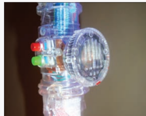
الجهاز الذي يعمل عن طريقه العكاز

● جاءت فكرة سترة النجاة البحرية من الإدراك بأن السفن البحرية الكبيرة وخاصة السياحية منها لا تملك عدداً كافياً من سترات النجاة لتكفي الركاب والطاقم العامل على السفينة في حال وقوع أي حادث غرق، وكما هو معروف فإنه في مثل هذه الحالات يتم