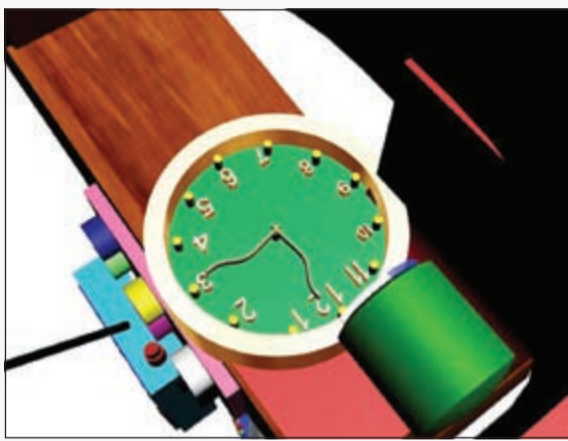
وساعة ملحقه بالعكاز

براءة الاختراع قد تأخذ وقتاً بحسب نوع الاختراع، وقد فاز بميدالية ذهبية في معرض الاختراعات الأخير.