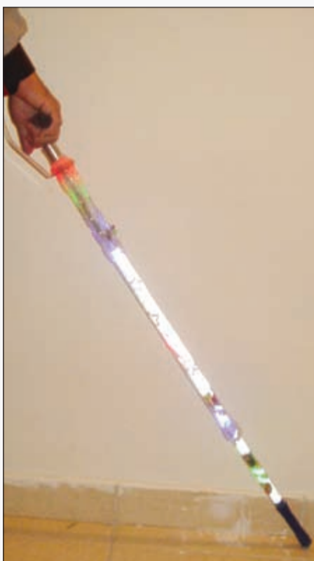
طريقة استخدام العكاز