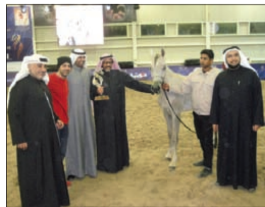
أحد الفائزين في العرض

شهدت منافسات اليوم الأول لبطولة الكويت الثانية لجمال الخيل العربية الاصيلة المنتجة محلياً والتي تقام برعاية سمو رئيس مجلس الوزراء الشيخ جابر المبارك قمة التنافس بين ملاك المرباط وجامهبرهم الذين ازدهمت بهم الصالة المغلقة بنادي الصيد والفروسية.