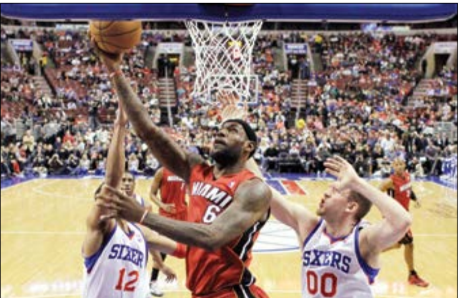
نجم ميامي هيت «الملك» لبيرون جيمس يضع الكرة في سلة فيلادلفيا بمضايقة من إيفان تيرنر وسبنسر هاوز (أ.ب)

وأصبح دورانت (25 عاماً) أول لاعب يتخطى حاجز الخمسين نقطة منذ مطلع الموسم. وكان أفضل رصيد سابقاً للاعب الملعب «دورانتولا»، 52 نقطة في يناير 2013. وجاء أداء دورانت بمنزلة الرد على لبيرون جيمس الذي قد يناقسه على جائزة أفضل لاعب في الدوري، إذ قال الأخير إنه بغار من دورانت لتسجيله «16 رمية من 32 محاولة أو 14 من 34 محاولة»، ملحقاً إلى العدد الكبير من الفرص الهجومية التي يحصل عليها خلفاً لنجم ميامي، وطرد مدرب سببرز غريغ بوبوفيتش في الربع الثالث بسبب الصراخ على الحكام. وعزز أوكلاهوما رصيده في المركز الثالث للمنطقة الغربية (30-10) برغم غياب موزع اللامع راسل وستبروك. وفي مواجهة بين فريقين الأكثر تنوعاً في الدوري، تغلب لوس انجيليس ليكرز حامل اللقب 16 مرة على ضيفه بوسطن سلتيكس المتوج 17 مرة 107-104، على ملعب «تي دي غاردن» أمام 18624 متفرجاً. لكن ليكرز يحتل رانها المركز الثالث في قاع المنطقة الغربية ويوسطن ليكرز في قاع الشرقية. وفي باقي المباريات، فاز تشارلوت بوبكاتس على أورلاندو ماجيك 111-101، وواشنطن ويزاردز على شيكاغو بولز 96-93، ولوس انجيليس كليبرز على نيويورك نيكس 109-95، وتورونتو رابتورز على مينيسوتا تمبر وولفز 94-89، ويوتا جاز على ديترويت بيستونز 110-89، ومفيس غريزلين على ساكرامنتو كينغز 91-90، ودالاس مافريكس على فينيكس صنز 110-107، وكليفاند كافالييرز على دنفر ناغتس 117-109.