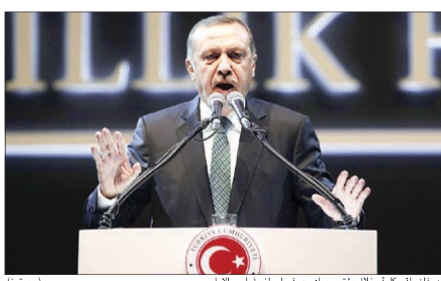
أردوغان يلقي كلمة خلال مؤتمر جماهيري في اسطنبول أمس الأول

استثنائها. ووفقا للمصادر، قال فولي إن ما تقوم به الحكومة التركية فيما يتعلق بالتحقيق في قضية الفساد يلحق ضررا باستقلال القضاء والفصل بين السلطات. وخلال اجتماعه مع أعضاء مجموعة أصدقاء تركيا، قال فولي إنه تحدث هاتفيا مع الرئيس التركي عبدالله غول ونائب رئيس الوزراء علي بابا كمال القى الضوء على القضايا التي يشعر الاتحاد الأوروبي بالقلق حيالها مثل إعادة تكليفات الشرطة وإعادة