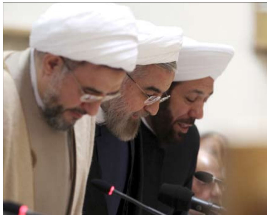
الرئيس الإيراني حسن روحاني متوسطا مفتي سورية أحمد حسون ورجل الدين الإيراني محسن العراقي في مؤتمر الوحدة الإسلامية بتهران أمس الأول

تفتيت أجهزة طرد مركزي - قرابة 18 ألفا حاليا - في هذه المواقع. وسيقوم مفتشون من الوكالة الدولية للطاقة الذرية التابعة للأمم المتحدة بالإشراف على تطبيق هذه الإجراءات والمصادقة عليها. وستقوم الدول الست في المقابل برفع عقوباتها المفروضة على قطاعي السيارات والطيران والأفرج عن حوالي 4.2 مليارات دولار من الأصول المالية المجمدة. وفترة الستة أشهر ستسمح بانطلاق مباحثات حول اتفاق