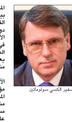
السفير الروسي سولوماتين

المسائل لحل الخلافات بينها بنفسها وبمساعدة القوى السياسية الأخرى دون استخدام السلاح لحل الأزمة»، مبينا «ان ما حدث في ليبيا وما يحدث الآن في العراق وسورية يجب ان تعلمنا ان الاسلحة لا يحل مشاكل العالم». وتابع سولوماتين «علينا الآن العمل على إيجاد انعقاد مؤتمر جنيف 2 وإنهاء المناقشات الازمة خلاله»، مشيرا إلى ان كل المناقشات مستمرة ومناصلة، مشددا على ضرورة عدم الوقوف