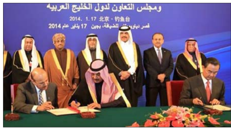
الشيخ صباح الخالد ود.عبدالله اللطيف الزباني أثناء التوقيع على الاتفاقية مع وزير الخارجية الصيني وانغ بي

لرئيس مجلس الوزراء ووزير الخارجية الشيخ صباح الخالد والأمين العام لدول المجلس التعاون د.عبدالله اللطيف الزباني فيما وقعها عن الجانب الصيني وزير الخارجية وانغ بي وفي الكلمة الافتتاحية للاجتماع الوزاري المشترك الثالث للحوار الاستراتيجي بين دول مجلس التعاون وجمهورية الصين الشعبية أكد الشيخ صباح الخالد أهمية العمل المستمر بين دول مجلس التعاون لدول الخليج العربية والصين من أجل تعزيز المصالح المشتركة. وهذا المستوى الجديد من التعاون في المنطقة وتأييده لدول المجلس التعاون د.عبدالله اللطيف الزباني فيما وقعها عن الجانب الصيني وزير الخارجية وانغ بي وفي الكلمة الافتتاحية للاجتماع الوزاري المشترك الثالث للحوار الاستراتيجي بين دول مجلس التعاون وجمهورية الصين الشعبية أكد الشيخ صباح الخالد أهمية العمل المستمر بين دول مجلس التعاون لدول الخليج العربية والصين من أجل تعزيز المصالح المشتركة. وهذا المستوى الجديد من التعاون في المنطقة وتأييده لدول المجلس التعاون د.عبدالله اللطيف الزباني فيما وقعها عن الجانب الصيني وزير الخارجية وانغ بي وفي الكلمة الافتتاحية للاجتماع الوزاري المشترك الثالث للحوار الاستراتيجي بين دول مجلس التعاون وجمهورية الصين الشعبية أكد الشيخ صباح الخالد أهمية العمل المستمر بين دول مجلس التعاون لدول الخليج العربية والصين من أجل تعزيز المصالح المشتركة. وهذا المستوى الجديد من التعاون في المنطقة وتأييده لدول المجلس