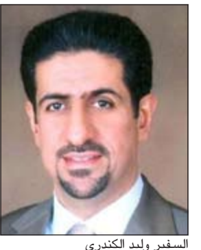
السفير ولاء الكندري

الخرطوم - كونا: كرمّت جمعية الهلال الأحمر السوداني الفريق الميداني لجمعية الهلال الأحمر الموجود بالسودان تقديرا للجهود الكبيرة التي قدمتها للجمعية لمساعدة متضرري السيول والفيضانات. وتضمنت الجمعية وندوات احتفالا حاشدا بهذه المناسبة بحضور سفيرنا لدى السودان طلال منصور الهاجري وقادة العمل التطوعي والإنساني بالسودان وعدد كبير من متطوعي الهلال الأحمر