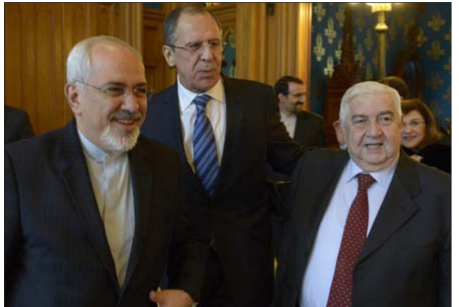
وزير الخارجية الروسي سيرغي لافروف خلال لقاء جمعه بنظيره السوري وليد المعلم والبراني محمد جواد ظريف أمس (اب)

وعاصم - وكالات: اعرب وزير الخارجية الروسي سيرغي لافروف عن قلق بلاده من محاولات تقليل عدد جماعات المعارضة السورية التي يجب ان يحضر ممثلوها مؤتمر «جنيف 2» للسلام في سورية.