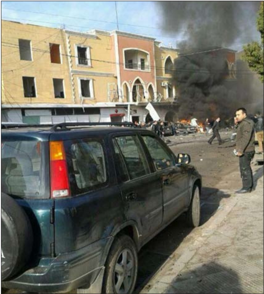
الديران مشتعلة في موقع انفجار السيارة المفخخة في الهرمل أمس