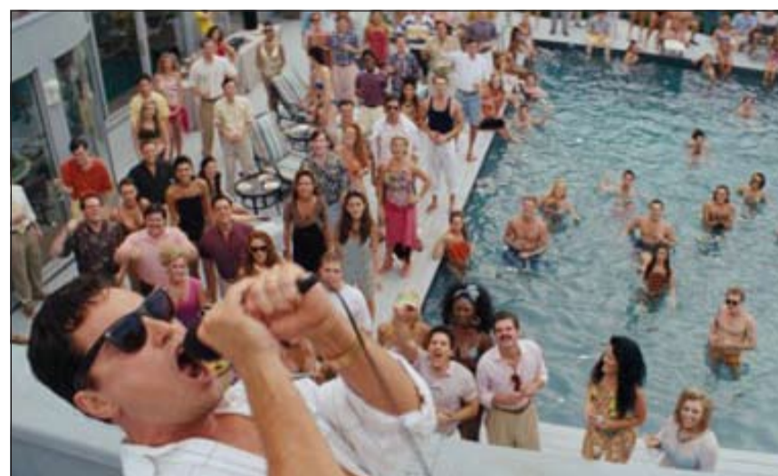
لقطة من فيلم «ذئب وول ستريت» ويبدو ليوناردو دي كابريو