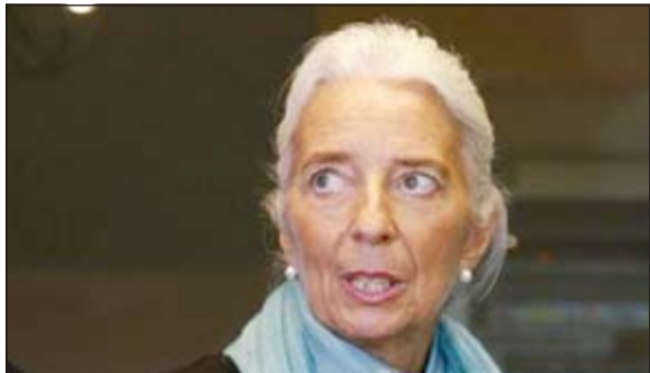
كريستين لاغارد رئيسة صندوق النقد الدولي