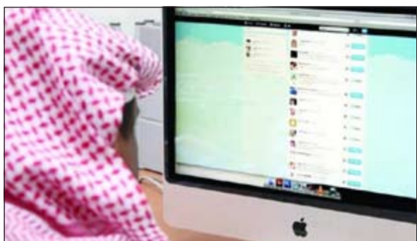
142 من مستخدمي الإنترنت بالسعودية لديهم حسابات على الموقع

و86٪ ممن يفضلون شبكة «يوتيوب» في السعودية أعمارهم تتراوح بين 12 و25 سنة، أما على أنستغرام