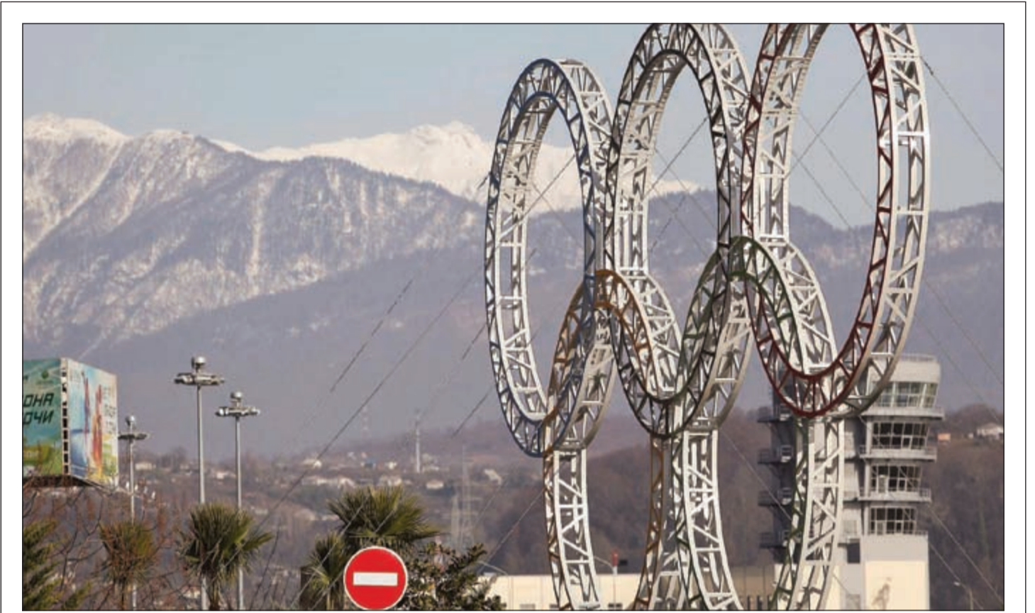
دورة الألعاب الأولمبية 2014 - سوشي الروسية

آخر أخبار الاقتصاد المحلية والعالمية زوروا موقعنا على www.alanba.com.kw/Business