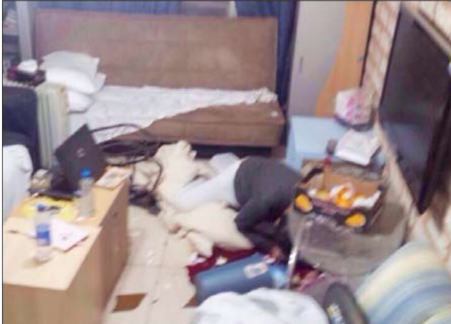
المجني عليه ملقى على ارض الشقة التي بدت مبعثرة محتوياتها