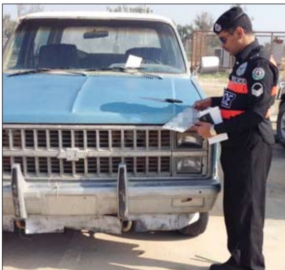
مركبة انتهت تامينها قبل سنوات في حملة امس الاول