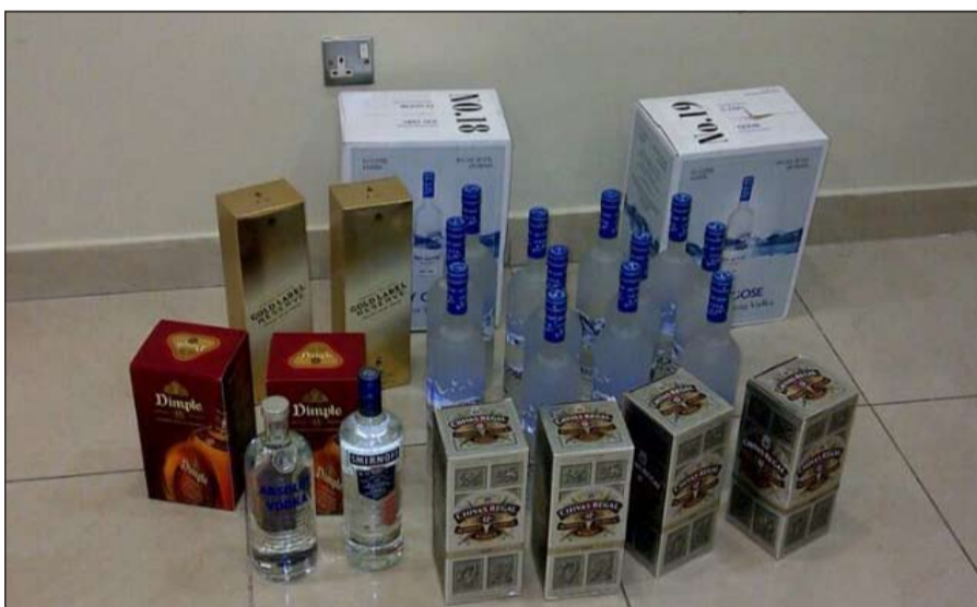
تشكيلة الخمر أحيلت إلى «الكافحة»

أحال رجال منفذ النوصيب امس الى الإدارة العامة لمكافحة المخدرات تشكيلة من الخمر المستوردة وذلك بعد العثور عليها أسفل احدي الأشجار في المنفذ، ورجح مصدر امني ان يكون هناك شخص مجهول بصدد تهريب هذه الخمر خلال قدومه البلاد، ولكنه خشي الضبط فأثر السلامة. وقال مصدر امني ان دورية وخلال قيامها بتفقد المنفذ عثرت على الخمر ملقاة وعددها 22 زجاجة مختلفة الأنواع، أسفل شجرة، فأبلغ مدير الإدارة الذي باشّر في اتخاذ الاجراءات القانونية.