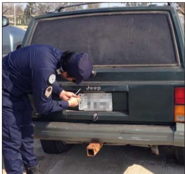
رجل مرور ينزع لوحة مركبة منبهة التامين ومتهالكة