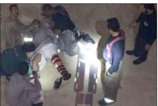
تقديم الإسعافات إلى الحدث