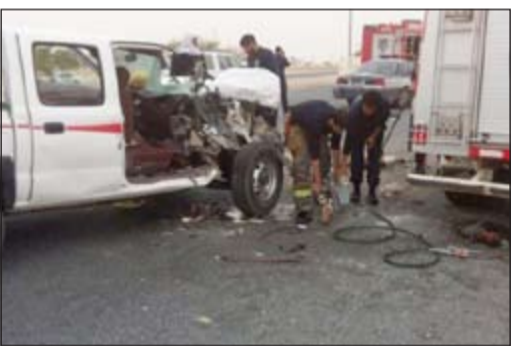
رجال الاطفاء بعد تعاملهم مع الحادث وتبدو المركبة وقد هشمت مقدمتها