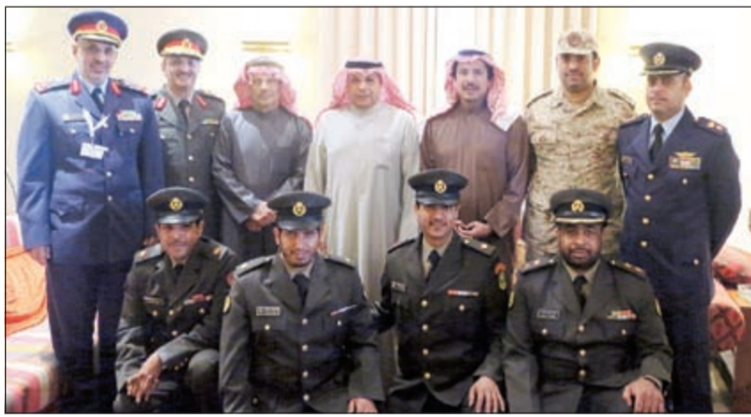
الشيخ خالد الجراح أثناء استقباله الضباط الكويتيين الدارسين بكلية القيادة والأركان الملكية لقوة دفاع البحرين

ووجه شكره بهذا الخصوص إلى مملكة البحرين ممثلة بقوة دفاع البحرين على توفير كل السبل لإنجاح الدورات التدريبية وعلى استضافتهم للضباط الكويتيين، داعيا الضباط إلى تحقيق أقصى الاستفادة من هذه الدورات المشتركة من أجل خدمة الوطن. يذكر أن الوزير خالد الجراح وصل إلى المنامة يوم أمس لحضور افتتاح معرض البحرين الدولي للطيران الثالث الذي تنطلق فعالياته اليوم.