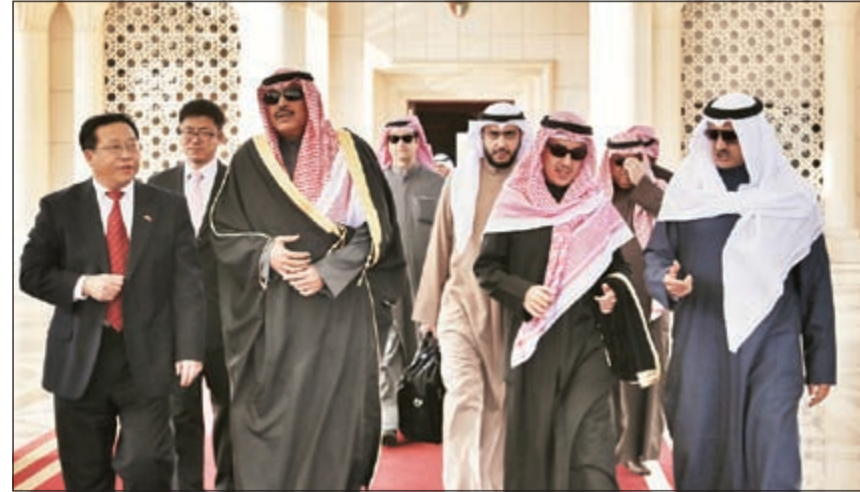
الشيخ صباح الخالد أثناء مغادرته إلى الصين

التعاون الخليجي (ويمكن أن تسهم) في بناء مشاريع البنية التحتية». وذكر أن الجانب الكويتي دعم هذه الآلية واقترح أن يتم تفعيلها وانعقاد الحوار على أساس سنوي مشددا على أن الصين تنظر إلى العلاقات مع الكويت على أنها مهمة جدا، عربيا عن أملة في أن يتم تبادل الزيارات بين المسؤولين رفيعي المستوى من البلدين. وأوضح «أنا نعتقد أن الأمر أكثر أهمية هو الشأن السياسي وأود التأكيد أيضا أن الأمن مهم بالنسبة للكويت والصين على السواء».