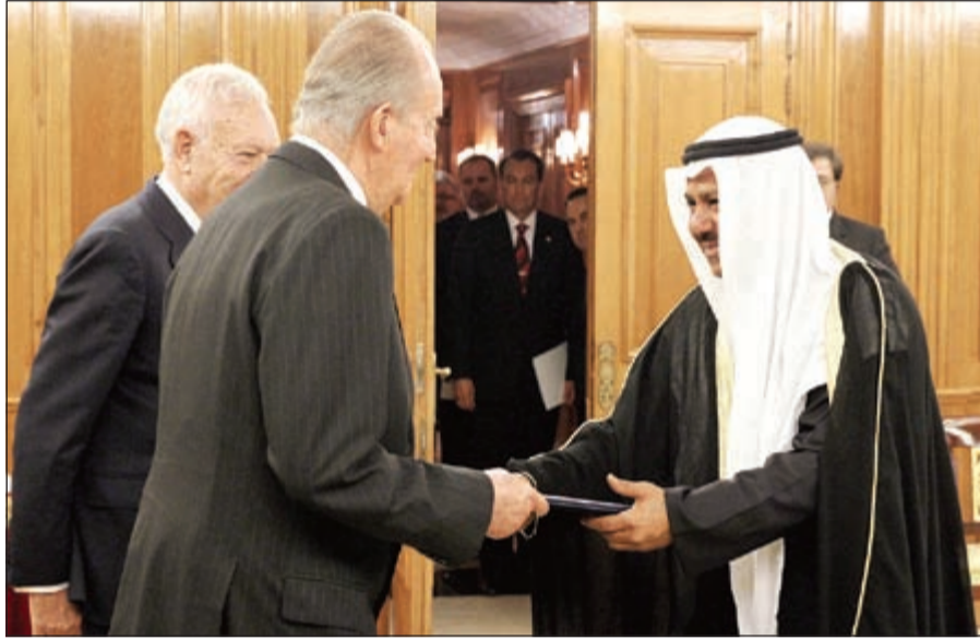
السفير الدكتور سليمان الحربي يقدم أوراق اعتماده سفيرا لدولة الكويت لملك إسبانيا

مدير - كونا: قدم السفير د. سليمان الحربي أوراق اعتماده سفيرا للكويت لدى مملكة إسبانيا للعاهل الإسباني الملك خوان كارلوس. وقال السفير الحربي - (كونا) عقب المراسم التي أقيمت في القصر الملكي بمدريد أنه نقل للعاهل الإسباني التحيات لصاحب السمو الأمير الشيخ صباح الأحمد. وأضاف الحربي أنه استعرض خلال اللقاء العلاقات الكويتية المتميزة مع مملكة إسبانيا وكذا العلاقات الطبية التي تربط بين صاحب السمو الأمير الشيخ صباح الأحمد والملك خوان كارلوس مشيرا إلى أنهما تطرقا أيضا إلى دور السفارة في تعزيز العلاقات الثنائية والارتقاء بها. وفي هذا السياق قال السفير الحربي أن