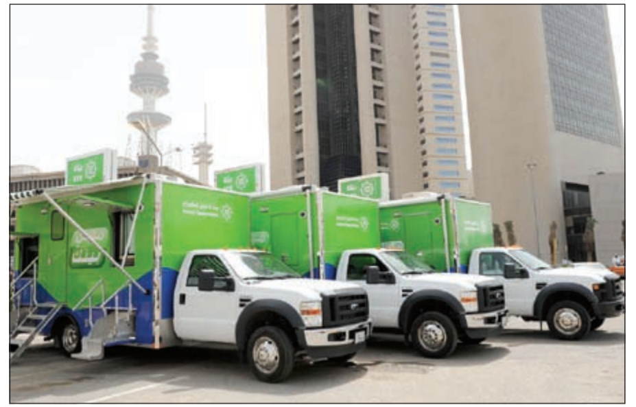
سيارات موبي «بيتك»

حققت مجموعة BMW الشرق الأوسط أفضل مبيعات لها على الإطلاق عام 2013، مع بيع 24,596 سيارة BMW وMINI في 12 بلدا في الشرق الأوسط، بزيادة نسبتها 15٪ مقارنة مع السنة القياسية الماضية عام 2012 (21,314 سيارة). وهذه السنة القياسية الثالثة على التوالي، مما يؤكد على موقع الشركة كمنجج مصنع للسيارات الراقية في العالم وشركة رائدة في فئة السيارات الراقية، على المستوى العالمي وفي الشرق الأوسط. بلغ مجموع عدد السيارات التي باعتها الشركة طوال العام، أي 24,596 سيارة، أكبر عدد من سيارات BMW وMINI يباع في الشرق الأوسط على الإطلاق. وشهدت كل الأسواق الخليجية مبيعات قياسية ونموا يتخطى الـ 10٪، وبقيت الإمارات السوق الأفضل مبيعا، إذ استأثرت بنحو نصف مبيعات BMW وMINI في المنطقة (46٪)، وكانت أبوظبي السوق الأكثر مبيعا، بحيث سجلت نموا بنسبة 15٪، بينما شهدت دبي زيادة في المبيعات نسبتها 10٪. أما خارج الإمارات العربية المتحدة، فبقيت المملكة العربية السعودية السوق الثالثة الأكبر مبيعا، مع بيع 4,228 سيارة ونمو بنسبة 18٪، تليها الكويت مع 3,910 سيارات ونمو بنسبة 19٪ والأردن مع نمو بنسبة 18٪ وقطر بنسبة 12٪ مع مبيع 354 و1,450 سيارة تباعا. وتعليقا على نجاح الشركة، قال ديورج بروير، المدير الإداري لمجموعة BMW في الشرق الأوسط: