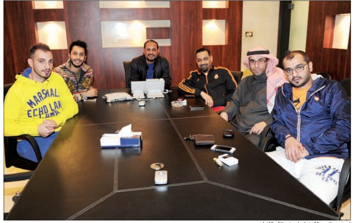
فريق برنامج «القمندة» في ضيافة «الأنباء»

أكدوا أنه أصبح رقما صعبا.. ونجح بسبب 3 عوامل