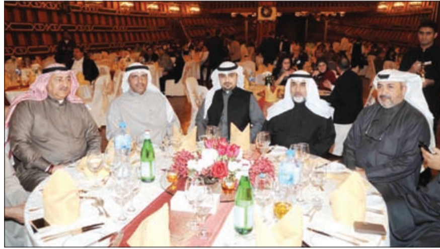
متابعة من الحضور للحفل

أقامت شركة مشعل سليمان الشطي الوكيل الحصري لماركة ميك أب ستور وعناصر سواروفسكي وصاحبة كل من ماركة شادو - بيت حناين - وسلسلة مطاعم زوار في الإقنيوز حفلها السنوي الأول بحضور فريق عمل الشركة من مديريين وموظفين، أقيم الحفل في قاعة الهاشمي - فندق راديسون بلو وقد تميز بأجوائه الدافئة التي جمعت أفراد أسرة العمل الواحدة.