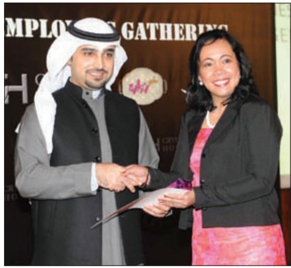
موظفة تتسلم تكريمها من الشطي