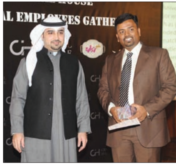
تكريم أحد الموظفين