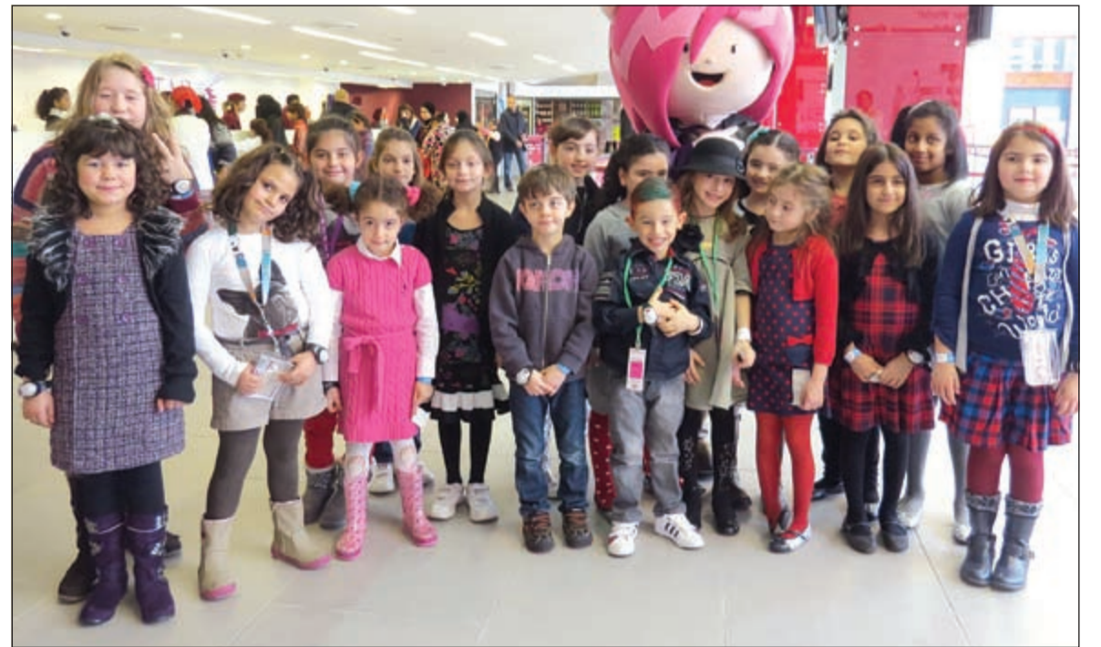
اصدقاء وصديقات تولين يشاركونها فرحتها.. ولقطة للذكرى