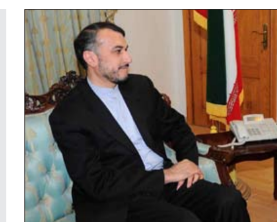
حسين أمير عبداللهيان خلال اللقاء مع الزميلة بيان عاكوم (أسامة أبو عطية)

اجراء من الدول الموجودة في هذه المنطقة يكون ضد إيران فكما زاد انسجام وقوة جيراننا في المنطقة أثر ايجابا على الانسجام والقوة لدينا فنحن