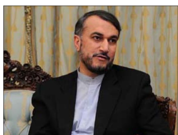
نائب وزير الخارجية الإيراني للدول العربية والأفريقية حسين أمير عبداللهيان

دور لدولة ما في تفجير السفارة فنسعلن عنه»، واستدرك قائلًا: «ولكن المهم ان دعم بعض الجهات من المجموعات التكفيرية المتطرفة يخلق جوا من عدم الاطمئنان وعدم الثقة وليس هناك اي دولة تستغني نفسها من الهجمات الإرهابية»، وفيما يلي تفاصيل اللقاء: