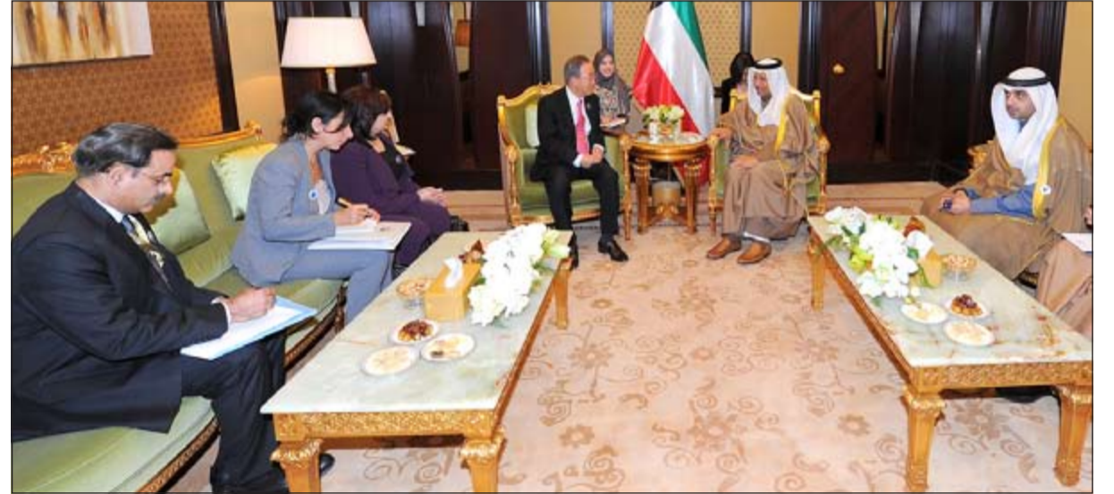
سمو الشيخ جابر المبارك خلال لقائه مع بان كي مون بحضور الشيخ محمد العبدالله

وتشكر جميع المساهمين على تبرعاتهم السخية»، سائلاً المولى التقدير أن يكمل هذه الجهود المباركة بالنجاح «وأن تخفف هذه المساعدات من معاناة المحتاجين وتنتهي هذه المسألة قريباً».