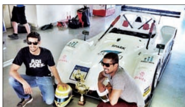
لقطة للذكرى مع الكاس وسيارة السائقين الكويتيين