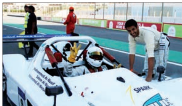
الاستعداد لانطلاق السباق