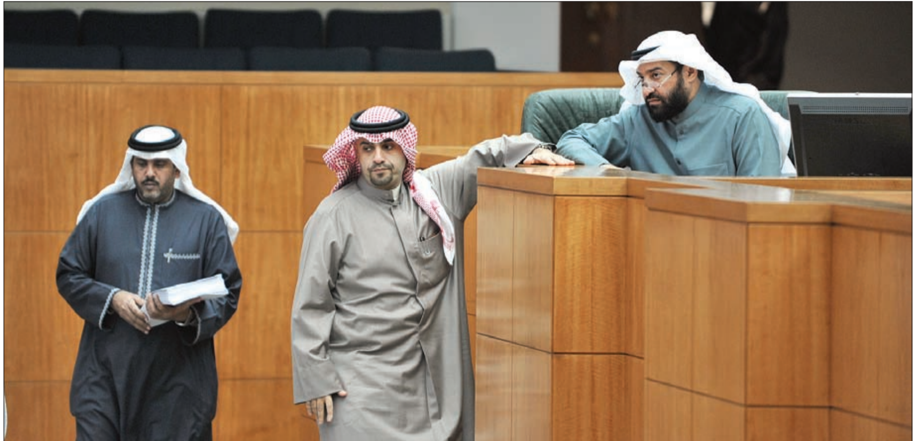
وزير النفط د.علي العمير ووزير المالية أسد الصالح في جلسة مجلس الأمة أمس الخاصة بمناقشة قضية «كي-داو» حيث انتهت إلى تكليف ديوان المحاسبة بإعداد تقرير عن القضية التي اعتبرها العمير مثلاً صارخاً لهدر المال العام في وقت نقلت «رويترز» عن الصالح انه ينوي متابعة سياسة سلفه الشيخ سالم عبدالعزيز بخفض الدعم وهي السياسة التي ظلت متبسة بسبب تصريحات متناقضة ويبدو الصالح أكثر وضوحاً بأنه سيرشد الدعم ليعمل إلى مستحقيه