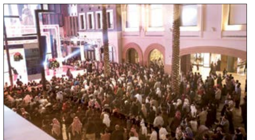
حشد كبير من الحضور لشاهدة سحب الدانة