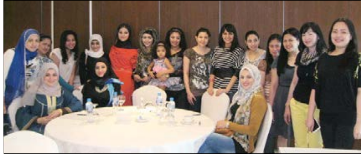
لقطة تذكارية للمشاركين في اليوم المفتوح

بأن مثل هذه اللقاءات هدفها الخروج من أجواء العمل الروتيني وتقديم الفعرات التعليمية والتدريبية لهم في أجواء تسمح بإظهار إبداعاتهم واستعدادهم