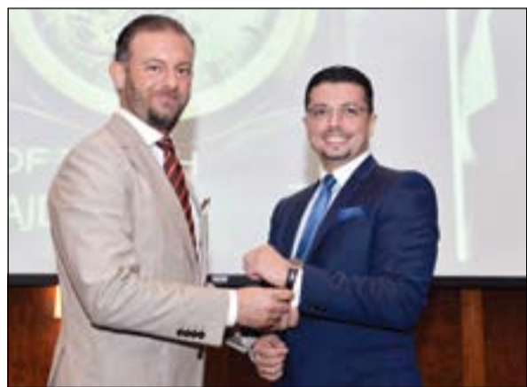
... «زينيت» ثمرة الإبداع الإنساني