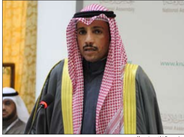
الرئيس الغانم يتحدث