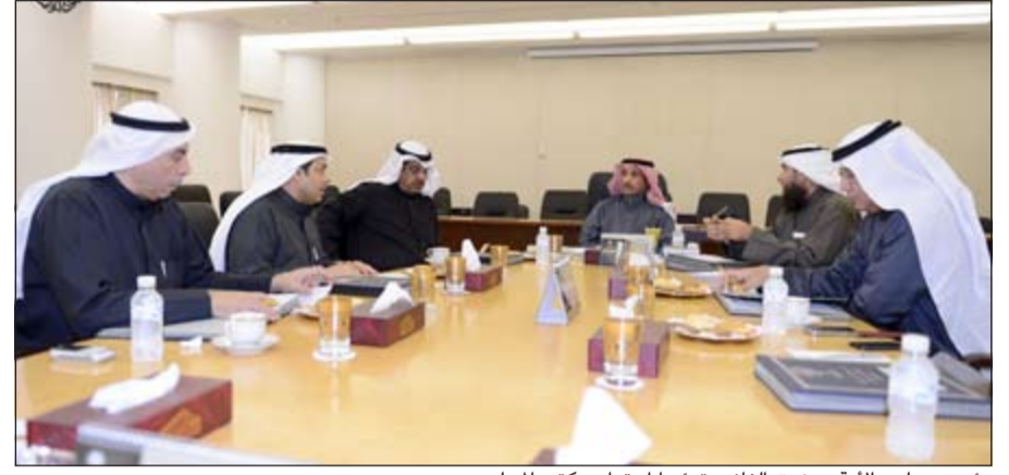
رئيس مجلس الأمة مزروق الغانم مترشقا اجتماع مكتب المجلس

من الشهر الجاري، وقرر تشكيل رؤساء مبعثات الشرف المرافقة للوفود البرلمانية المشاركة. وقال الصانع إن مكتب المجلس قبل بعض الدعوات الموجهة إلى مجلس الأمة من قبل بعض البرلمانات الشقيقة والصديقة لزيارتها على أن تحدد مواعيد الزيارة لاحقا. من جهة ثانية، استقبل الرئيس الغانم رئيس وأعضاء نقابة الخطوط الجوية الكويتية.