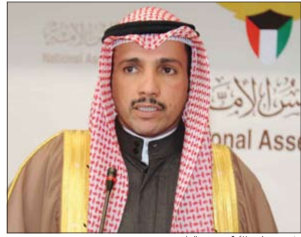
رئيس مجلس الأمة موزون الغانم

أكد رئيس مجلس الأمة موزون الغانم أنه لم يبلغ بأي موقف حكومي بشأن حضور الجلسة الخاصة المقرر عقدها غدا الثلاثاء لمناقشة قضية «الداو»، مشيراً إلى أن الموقف الحكومي حيال الحضور من عدمه قد يتضح غدا (اليوم) بعد اجتماع مجلس الوزراء، وهو ما صرح به وزير النفط د.علي العمير في جلسة المجلس الأخيرة. وأوضح أنه وجّه الدعوة لحضور الجلسة، فإذا حضرت الحكومة واكتمل النصاب ستعقد الجلسة، وإذا