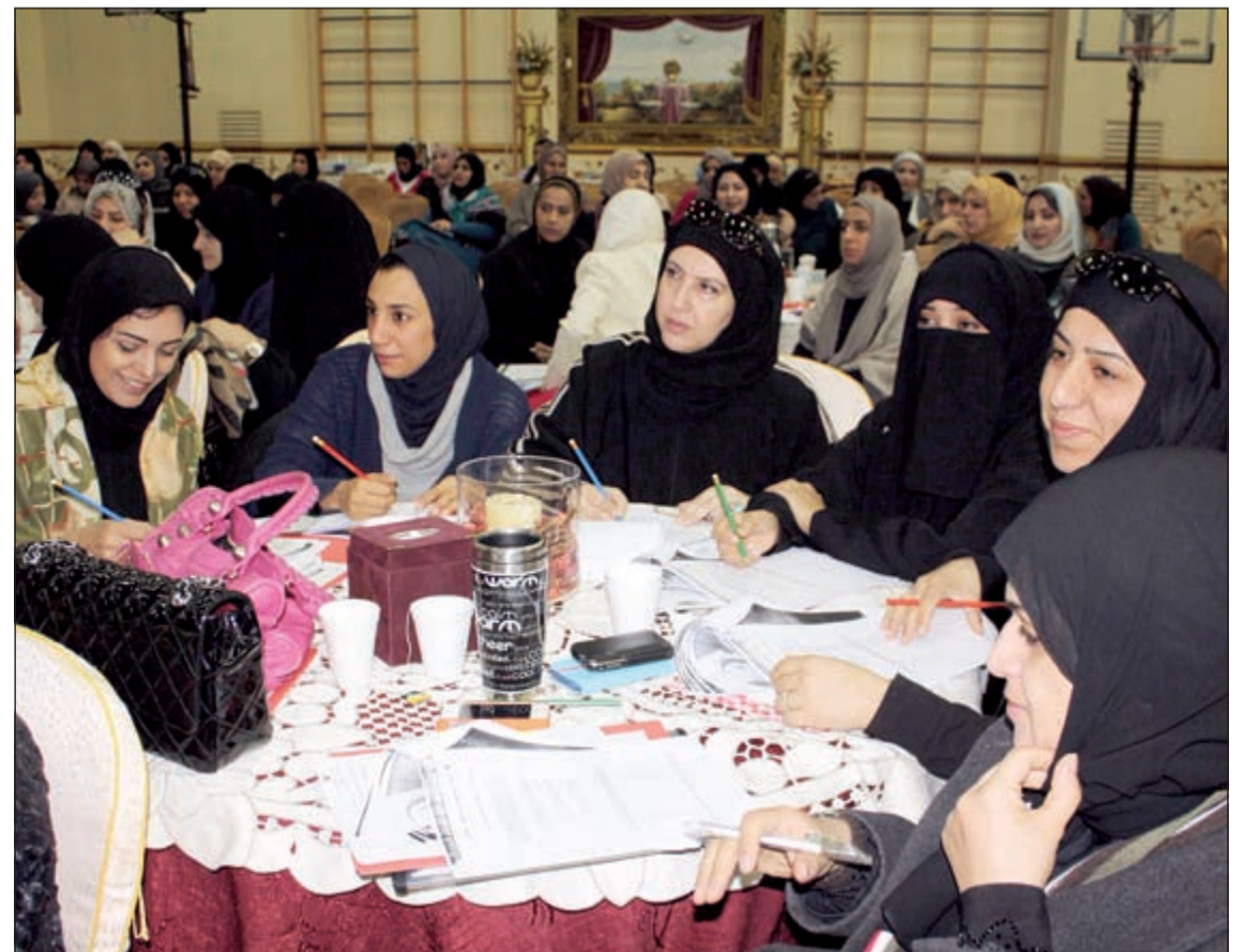
متابعة من المرشحات للوظائف الإشرافية

الجامعة الأمريكية في الكويت مرخصة بالمرسوم الأميري رقم 139 لسنة 2003 وحاصلة على الاعتماد المؤسسي من مجلس الجامعات الخاصة - وزارة التعليم العالي في دولة الكويت. ترتبط الجامعة الأمريكية في الكويت بمذكرة تفاهم وتعاون مع Dartmouth College الأمريكية.