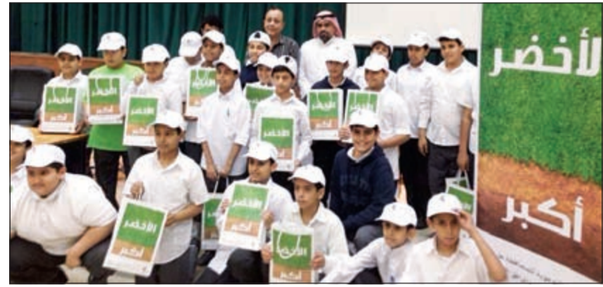
مجموعة من الطلبة خلال مشاركتهم في الحملة