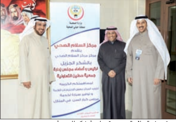
مستوصف السلام الصحي يقدم لوحة شكر للجمعية