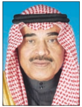
الشيخ صباح الخالد

وقالت وزارة الخارجية في بيان أن الرسالة «تتصل بالعلاقات الثنائية بين البلدين الصديقين في كافة المجالات والمستجدات الراهنة على الساحتين الإقليمية والدولية».