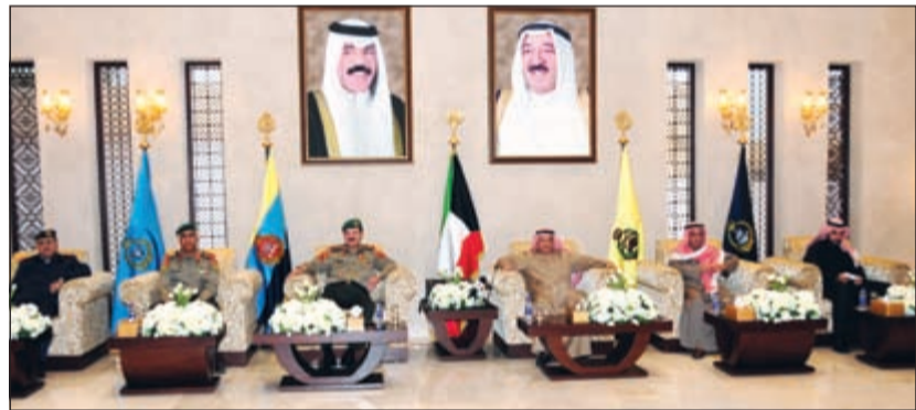
الشيخ خالد الجراح والفريق عبدالرحمن العثمان مع المكرمين

القائد الأعلى للقوات المسلحة الشيخ صباح الأحمد وسمو ولي العهد وسمو رئيس مجلس الوزراء.