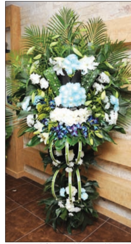
زهور من النائب محمد طنا في عيد «الانباء»

تعبيراً عن تقديرهم للدور الوطني والإعلامي الذي قامت وتقوم به «الانباء»، عبر محبوها عن اطلب امتناتهم لها وللقائمين عليها والعاملين فيها بدوام التقدم والنجاح وأن تبقى دواماً صرحاً اعلامياً شامخاً في نقل الحقائق والاحداث بكل صدق وحيادية، وفيما يلي بعض من تلك التهاني بعيدها الـ 38: