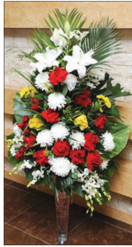
وكيل وزارة المواصلات م.حبيب القطان بارك لـ«الانباء» بالزهور