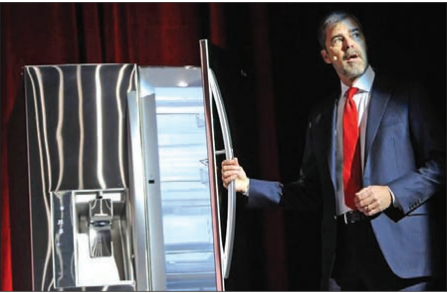
أحد مسؤولي المعرض يشرح كيفية التعامل مع التلاجة الذكية