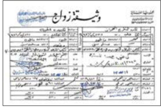
الوثيقة التي ثبتت زواج رويدا وعبدالكريم