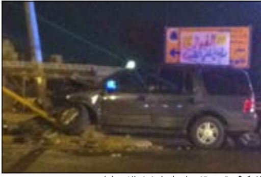
المركبة وقد توقفت إجبارياً بفعل الاصطدام