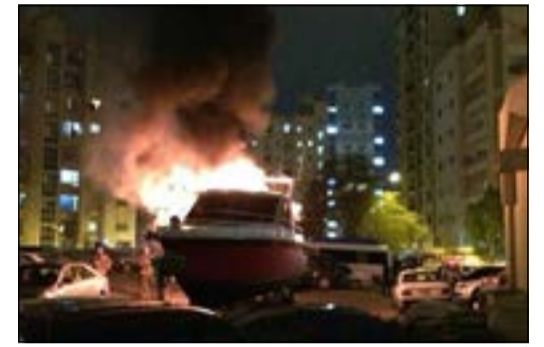
الحريق في بدايته

وأشار المصدر إلى أن صاحب المنزل ولدى سؤاله عما إذا كان يتهم أحداً بالحريق العمداً، قال إنه يتهم ابنه بهذه الواقعة اثر خلاف اندلع بينهما، وسجلت قضية حريق عمداً بامر من النيابة العامة تحت رقم 6/2014.