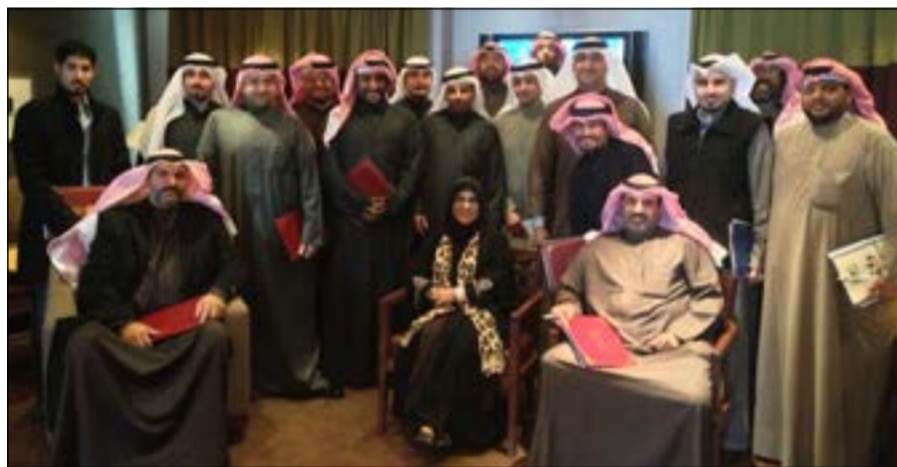
المشاركون في ندوة الأحداث

للجميع التوفيق. ونظمت وزارة الشؤون الاجتماعية والعمل - إدارة رعاية الأحداث بالتعاون والتنسيق مع معهد القديمة للنفس، محددات الذات وكيف تخطط لإهدافك للتوافق النفسي، ويدخل هذا الموضوع ضمن برنامج عمل الحكومة لخطة التنمية السنوية للعام 2014/2013.