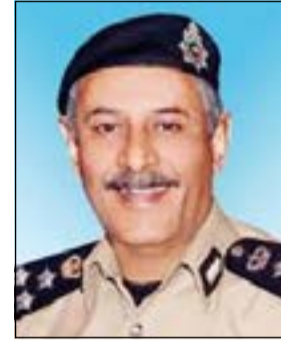
العميد زهير النصرالله

والإنساني على مدار الساعة وأن هناك متابعة من كل الدوريات سواء كانت ثابتة أو متحركة لرصد ومكافحة