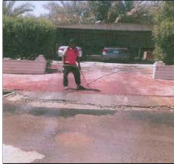
رش المياه احد مظاهر الاستعمال الخاطى للمياه

يعتذر النائب د.احمد مطيع العازمي عن عدم استقبال رواد الديوانية اليوم الاحد الموافق 2014/1/12 نظرا لتواجده خارج البلاد للمشاركة مع وفد اعضاء الشعبة البرلمانية بمهمة رسمية.