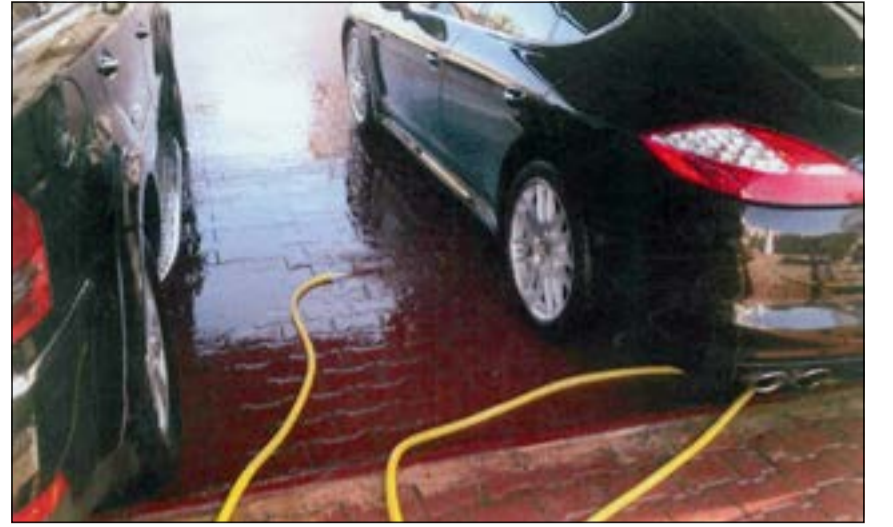
هدر كبير للمياه في عمليات غسل السيارات