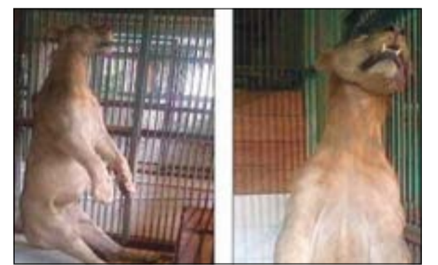
الأسد مات شققاً

جاكرتا - وكالات: في واقعة غريبة ظهرت ضحية جديدة في حديقة الحيوان «سورابايا» إندونيسيا والتي توصف بأنها الحديقة الأكثر قسوة في العالم، وفقاً لتصنيف مجموعات حقوق الحيوان.