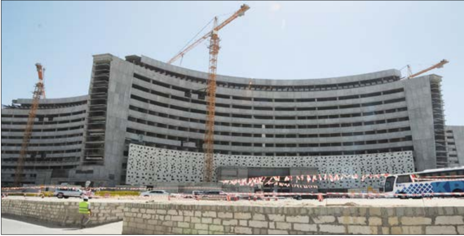
مبنى مستشفى الشيخ جابر من المشاريع الجديدة المنتظرة

الذين قاربت مدة نديهم على الانتهاء، حيث يفترض أن يتم ترشيح الأسماء الجدد لتولي هذه الوظائف نهاية يناير الحالي، وافتتاح مكتب للصحة العالمية، فضلا عن تنظيم آلية ابتعاث المرضى للعلاج بالخارج، وإعطاء كل ذي حق حقه في العلاج، والمشاريع الجديدة من أبراج في المناطق الصحية ومستشفيات جديدة من المزمع إنشاؤها في مناطق الفروانية والصباح والاحمدى والعاصمة، والتي تم توقيع عقود معظمها وطرحها خلال لجنة المناقصات المركزية، ومنح الصلاحيات المالية والإدارية للمناطق الصحية والمستشفيات لتذليل كل العقبات من أمامهم والتسهيل عليهم في تقديم الخدمة الطبية للمرضى والمراجعين، وغيرها من الملفات المهمة التي سيتم تباعثها، فضلا عن الالتزام بتنفيذ توصيات وقرارات مؤتمر وزراء الصحة لدول مجلس التعاون الخليجي الذي عقد في الكويت الأسبوع الماضي.