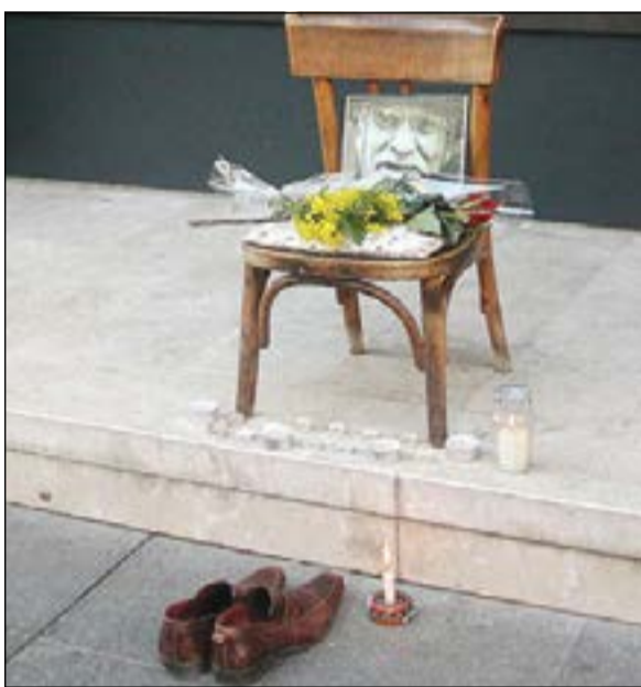
الكرسي الخشبي الذي تم وضعه في جادة تيتو الرئيسية في سراييفو

وعندما حوصرت سراييفو في أبريل 1992 لم تخطب عمليات القصف اليومية ومجازر المدنيين عزيمة كيكسا ميسو.