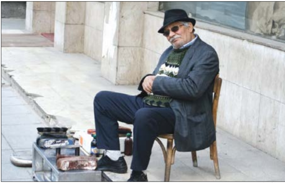
ماسح الأحذية ميسو

عمان - إبلاف: انتشر مقطع فيديو على اليوتيوب يقال إنه لحادثة سرقة تمت في الأردن، قامت سيدة خلالها بابتلاع خاتم من الذهب، بينما كان صاحب المحل منشغلا بالميزان وحساب ثمن أحد الخواتم التي استهوت «السارقة»، حينها قامت «اللمسة المتحمسة» بانتشار خاتمها، فابتلعت الأولى، وتظاهرت بأنها تجرب الآخر. لتكون تلك الحادثة من أغرب حالات السرقة في العالم، ولولا الكاميرا التي رصدت العملية لنجت السيدة بقلعتها ولم يتمكن أحد من اكتشاف طرقها المبتكرة في اللصوصية وبالتالي محاسبتها.