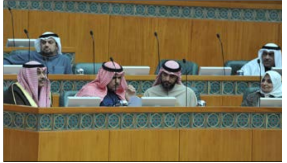
الشيخ صباح الخالد والشيخ سلمان الحمود ودحسين قويمان وهند الصباح