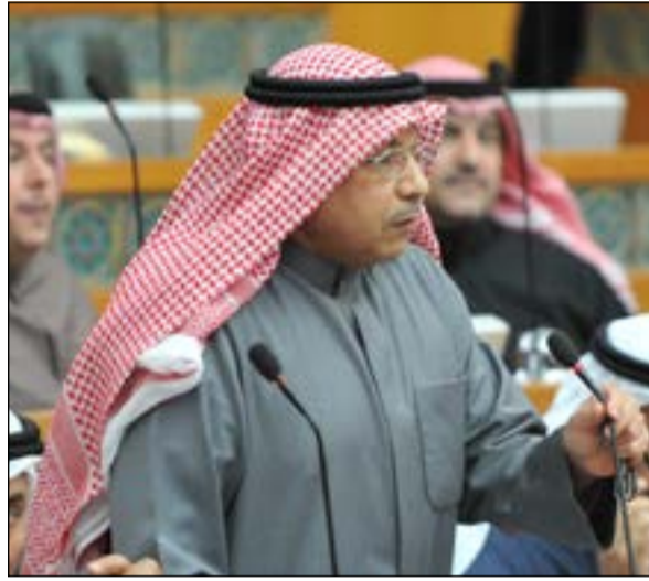
الشيخ خالد الجراح