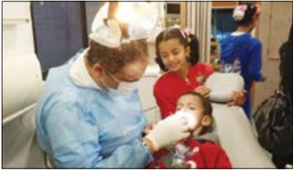
فحص أسنان أحد الأطفال