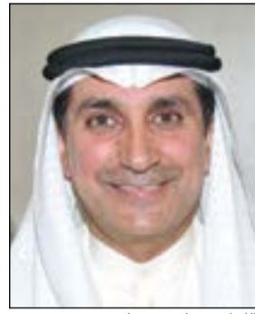
لواء م. نواف شعبان