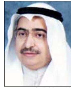
لواء م. عادل الابراهيم