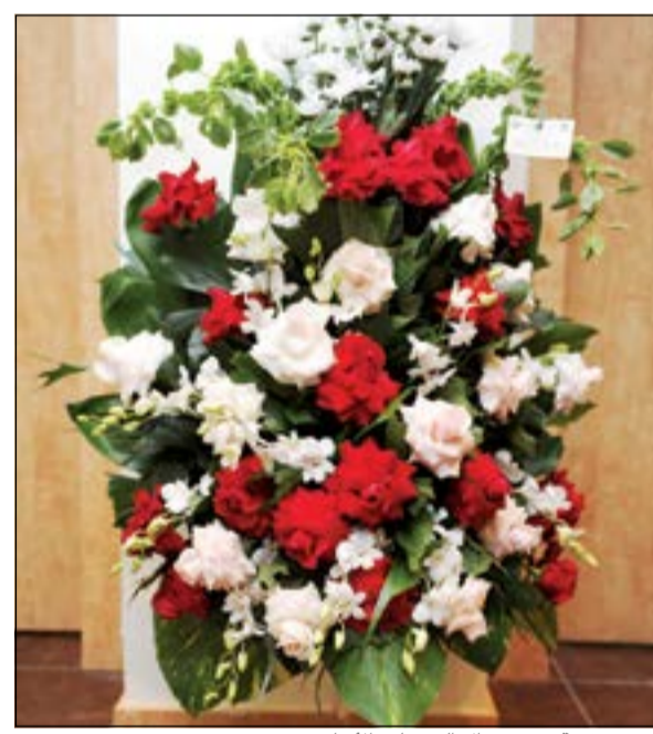
زهور موقمنة من د. براك الثون لـ «الأنباء»