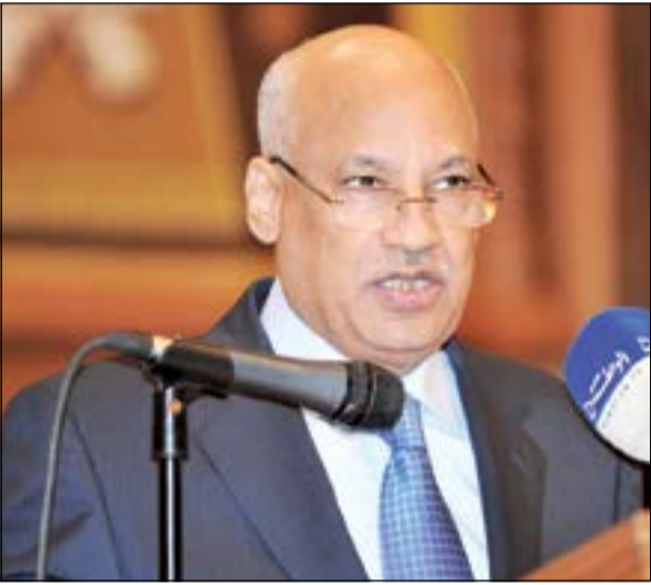
السفير عبدالكريم سليمان يلقي كلمة المستشار عدلي منصور