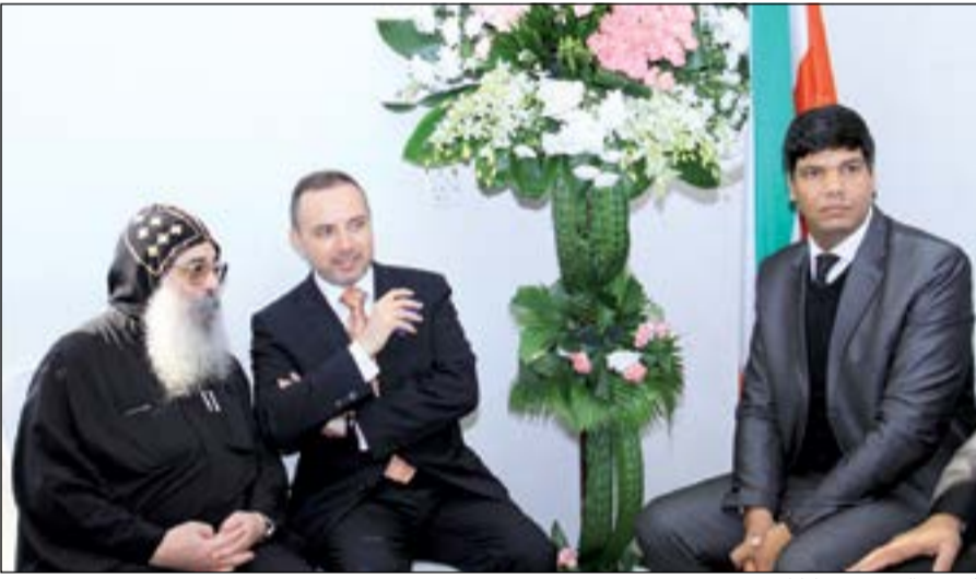
السفير الفرنسي مبارك

وتوجه بيجول بكل الشكر والامتنان للكويت الشقيقة أميراً وحكومة وشعباً لما تقدمه من اهتمام ورعاية دائمين لأبناء الجالية المصرية، بما يعكس عمق العلاقات الأخوية بين الشعبين الشقيقين.