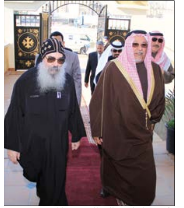
الشيخ علي الجراح يصل الكنيسة لتقديم التهاني للأبنا بيجول