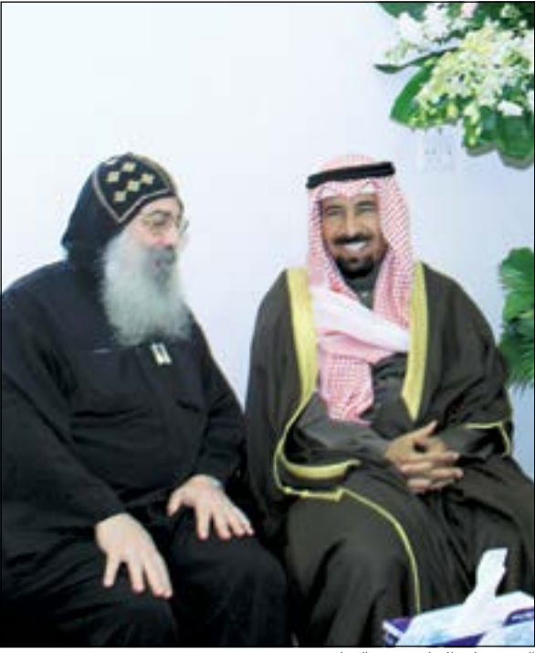
الشيخ علي الجابر يقدم التهاني