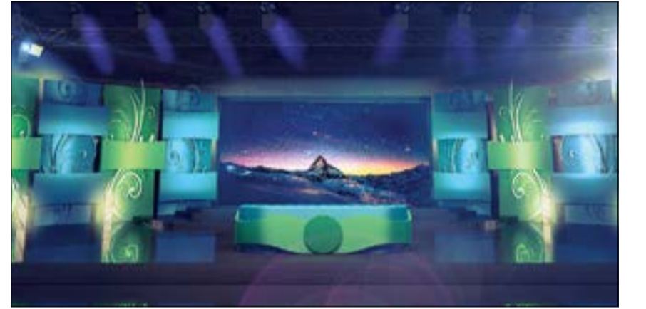
من المسارح التي تستعد لاستقبال عروض المهرجان