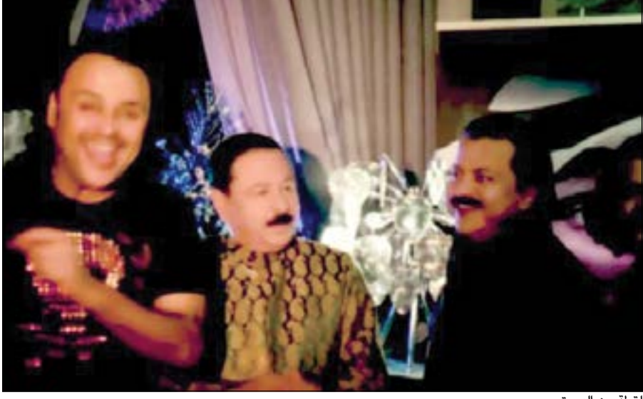
لقطة من الفيديو