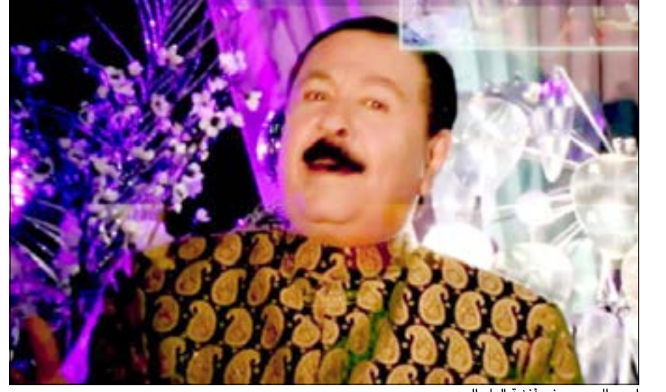
أحمد الجميري في أغنية العام الجديد