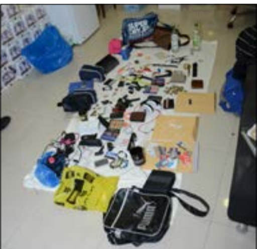
جزء آخر من المسروقات