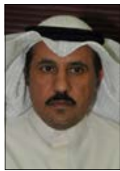
العميد صالح الغنام

وكانت المعلومات الواردة قد كشفت عن قيام وافدين بالاتجار في المواد المخدرة، وعلى الفور تم تشكيل فريق عمل لرصد تحركاتهما والقيام بالمزيد من التحريات والتي أكدت صحة المعلومات الواردة وتم اتخاذ الإجراءات القانونية اللازم والاتفاق معهما على شراء (10000)