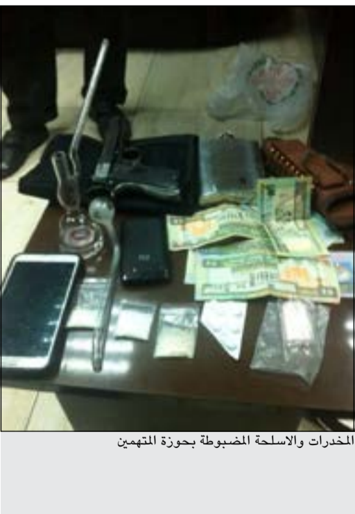
المخدرات والأسلحة المضبوطة بحوزة المتهمين

تمكنت إدارة مباحث محافظة حولي التابعة للإدارة العامة للمباحث الجنائية من ضبط مواطنين قاما بارتكاب العديد من حوادث سرقة المركبات عن طريق الكسر وسرقة محتوياتها وبيعها إلى شخص ثالث يقوم بتصرف تلك المسروقات. وذلك بعد ورود عدة بلاغات من المواطنين بعدة