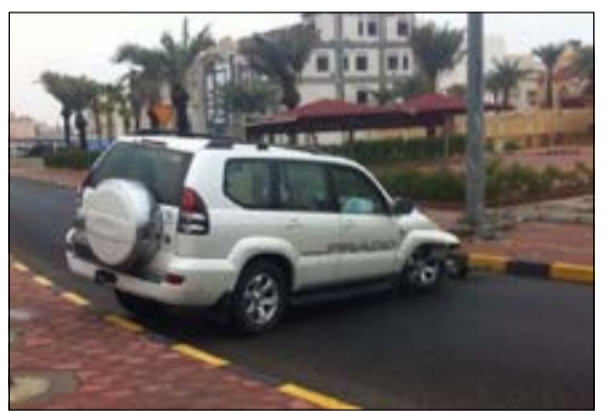
سيارة المواطن بعد اصطدامها بالشبنة

وقال مصدر أمني إن بلاغا ورد إلى غرفة عمليات الداخلية عن وجود حادث تصادم، وعليه توجه رجال دوريات المرور إلى موقع البلاغ فتبين إصابة شاب عشريني بإصابات متفرقة نقل على إثرها إلى المستشفى. وأشار المصدر إلى أن الشاب قال: انزلت سيارتي من المطر ولم أستطع السيطرة على مقود المركبة لأصطدم بعمود الإنارة الواقع في منطقة جنوب السرعة. من جانب آخر، فقد أحيل مواطن إلى مخفر الجابرية بعد اصطدامه بالسياج الحديدي الفاصل بين منطقتي الجابرية وحولي فتبين أن المواطن كان بحالة غير طبيعية، وعلى صعيد متصل، فقد شهد طريق الدائري السادس السريع حادث تصادم بين مركبتين أسفر الحادث عن إصابة شاب بإصابات متفرقة نقل على إثرها إلى مستشفى الفروانية.