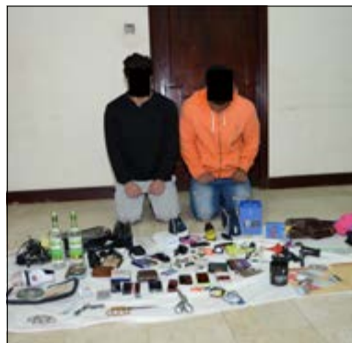
المواطنان المتهمان وامامهما كمية من المسروقات

مناطق بالبلاد عن سرقة مركباتهم عن طريق الكسر والاستيلاء على كافة المحتويات بداخلها. حيث تم تشكيل فريق بحث من الإدارة العامة لمباحث حولي وتم جمع التحريات والاستدلالات عن المتهمين، وبعد استخراج الإذن القانوني اللازم تم ضبط المواطنین المتهمين بمنزلهما وتم العثور على العديد