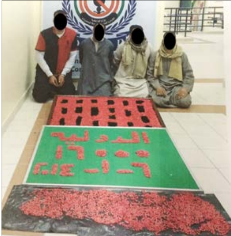
المتهمون الأربعة وامامهم كمية المخدرات المضبوطة

تمكن رجال إدارة مكافحة الدولة التابعة للإدارة العامة لمكافحة المخدرات من ضبط أربعة وافدين من إحدى الجنسيات العربية يقومون بجلب مواد مخدرة إلى البلاد «مؤثرات عقلية ترامادول».