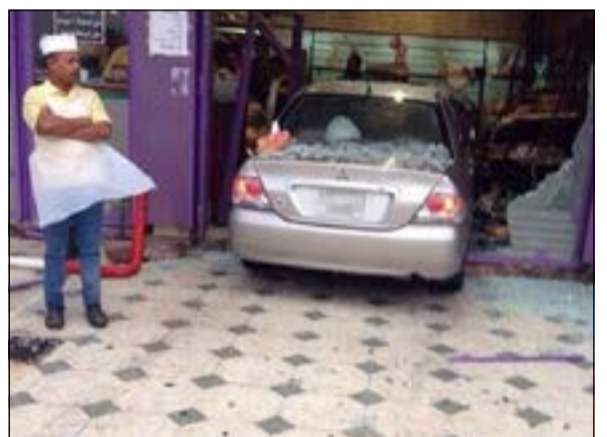
أحد باعة المحل يقف بجانب السيارة المتحتمة

اقتحمت مركبة يابانية مخبزاً في جمعية الرميحية صباح امس ولم يسفر الحادث عن وقوع اي اصابات تذكر، لا بين العاملين ولا قائد السيارة، وكان المحل لحظتها خالياً من أي زبائن واقتصر الأضرار على التلفيات التي لحقت بواجهة المحل. وقال مصدر امني ان بلاغا ورد الي غرفة عمليات الداخلية عن اقتحام سيارة احد محلات جمعية الرميحية التعاونية وبناء عليه هرع رجال الامن والاسعاف الي موقع البلاغ وتبين ان قائد السيارة كان يريد التوقف بالمواقف المقابلة للمخبز إلا أنه وبدلاً من أن يدوس بقدمه على دواصة الفرامل قام بالضغط بالخطا على دواصة البنزين لتتنطق السيارة باتجاه المحل وتقتحم واجهته بعد أن حطمت الحاجز الحديدي الفاصل بين المواقف والرصيف.