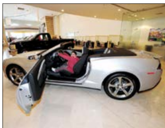
أحد الطلبة خلال الاطلاع على إحدى السيارات

حيث تم الترحيب بهم وشرح برنامج الزيارة لينطلقوا بعدها في أركان ومراقف المعرض للتعرف على كل الأنشطة والفعاليات التي تتم في هذا المعرض ابتداء من لحظة دخول الزبائن وطريقة استقبالهم وتعريفهم بالسيارات وتقديم الاستشارة لهم ليكون اختيار الزبائن مبنيا على