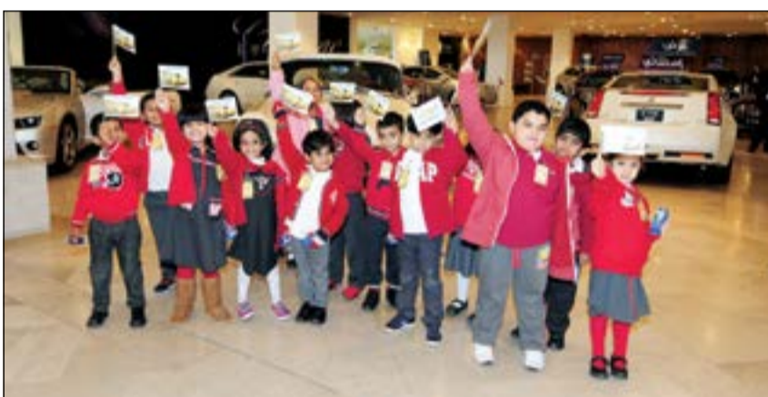
طلاب روضة الأحد خلال زيارتهم معرض السيارات

معرفة كافية بالسيارة التي يختارها كل عميل بما يتوافق مع رغبته واحتياجاته. وقام فريق المبيعات بالتعريف عن سيارات شفروليه وكاديلاك وما يميز كل سيارة، وكذلك مواصفات الرفاهية وتجهيزات السلامة والأمان في كل واحدة من هذه المركبات التي أصبحت أيقونة عالمية في مجال التطور