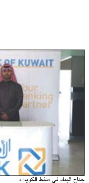
جناح البنك في «نفط الكويت»

يقدم البنك العديد من الخدمات المصرفية بمميزات حصرية للعملاء، حيث يتواجد البنك في