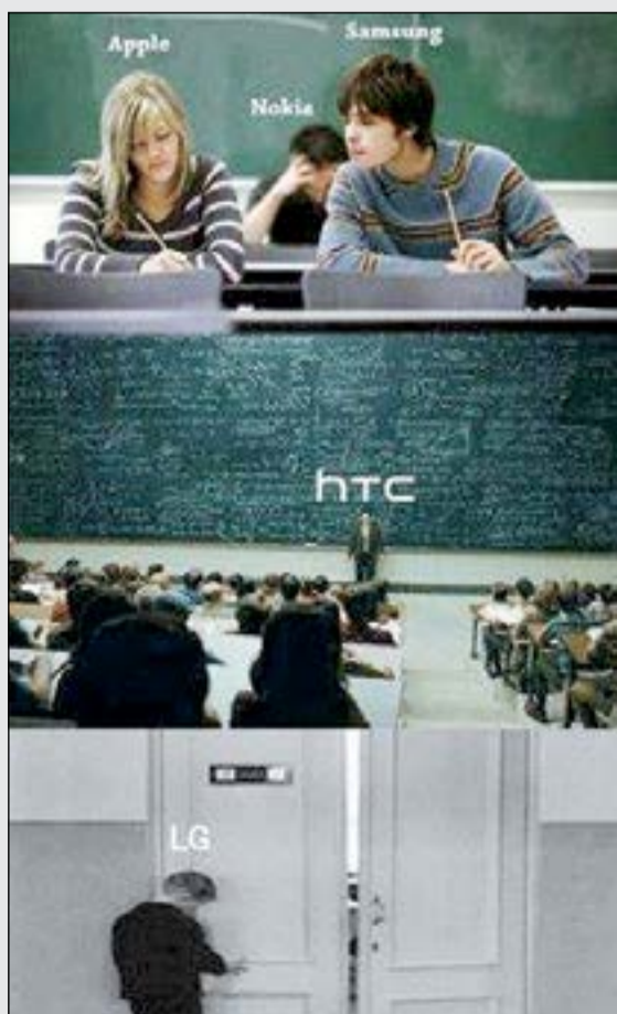
عالم الأجهزة الذكية مليء بالشركات منها الرائد مثل «آبل»، والذي يتخذ الأفكار مثل «سامسونج»، وهناك شركات ترأب من بعيد فهل تتغير المقاعد في يوم ما؟

يوماً بعد آخر تستمر شركات التكنولوجيا المختصة في المعلومات في تبسيط استعمال مكتشفاتها الحديثة التي تراكمت دون أن يلتحق بها المستهلك في أحيان كثيرة. ونجد أن عالم التكنولوجيا الحديثة والذي قد يحمل في بعض معطياته جوانب السخرية فإنه يظل عالماً مليئاً بالأبعاد الاقتصادية التي يبحث عنها الكثيرون حيث