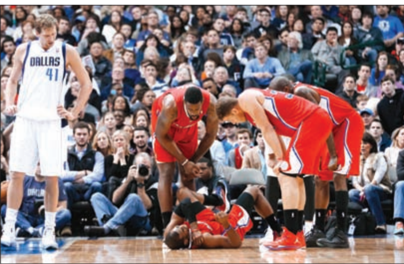
لوس أنجيليس كليبرز سيفقد جهود نجمه كريس بول للإصابة

الانتصارات بعد خسارتين على التوالي. وإلى جانب لاعب فريق كل النجوم هاردين، تألق مع روكس تشاندلر باروسون صاحب 17 نقطة و 11 متابع، فيما سجل للخاسر إيمان شوميرت 26 نقطة والنجم كارميلو أنطوني 25 نقطة. وأوقف لوس أنجيليس ليكرز سلسلة من 6 خسارات متتالية بتغلبه على ضيفه يوتا جان 110 - 99 على ملعب «ستيتبلز سنتر» أمام 18997 متفرجا. وفي ظل اعتماد مدرب ليكرز مايك دانغوني على سادس موزع هذا الموسم لكثرة الإصابات، أبرزها نجم الفريق كوبي براينت، كان الإسباني باو غاسول لدى الفريق الأصفر مع 23 نقطة و 17 متابع. وسجل أندريه إيغودالا سلة حاسمة من خارج القوس في الوقت القاتل ليمنح غولدن ستايت ووريوز الفوز على ضيفه أتلانتا هوكس 101 - 100 على ملعب «فيليبس أرينا» أمام 15210 متفرجين. وأنهى ووريوز بذلك سلسلة من 5 انتصارات متتالية لهوكس على أرضه في السدوري والحق به الهزيمة الـ 15 هذا الموسم مقابل فوزه في 18 مباراة. وهذا الفوز الثامن على التوالي لوريوز، الذي برز مجددا في صفوفه الموزع ستيفن كوري وديفيد لي وكلاي طومسون. وفي باقي المباريات، فاز تورونتو رابترز على واشنطن ويزاردز 101 - 88، ونيو أورليانز بيليكانز على بوسطن سلتيكس 95 - 92، وديفر غانغس على مفييس غريزليز 111 - 108.