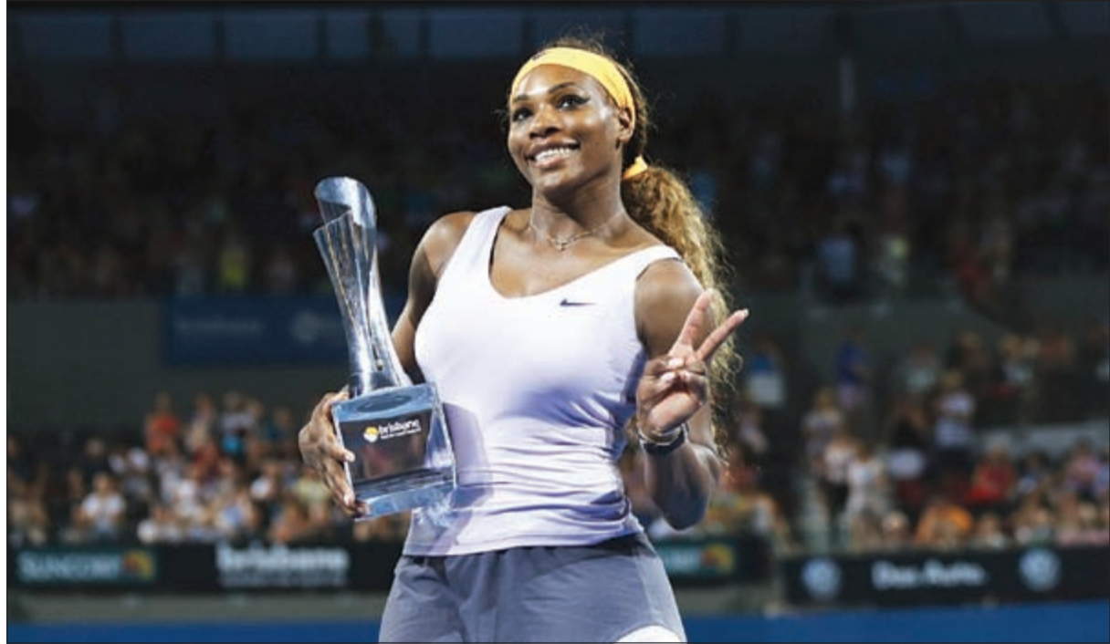
سيرينا وليامس حاملة كأس دورة «بريزبين»

كثيرا أمامه في بداية مسيرتي»، إيفانوفيتش تهزم وليامس في نهائي «أوكلاند». من جانب آخر، تابعت الصربية أنسا إيفانوفيتش المصنفة ثانياة تألقها وأحرزت واحدا العام الماضي: «عانيت مسيرة اللاعبين الذين يبلغان 32 عاما. لكن مع الوقت وبعد أن أصبحا والدين تغيرت النظرة. وتابع فيدرر الذي أحرز لقبيا واحدا العام الماضي: «عانيت