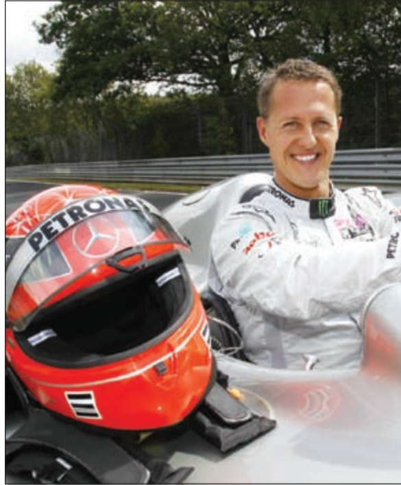
البطل الألماني المعتزل ميكائيل شوماخر

واستحوذ المحققون على كاميرا كانت مثبتة على خوذة لشوماخر. وذكر مصدر «فرانس برس» أن المحققين استمعوا إلى ابن شوماخر، ميك (14 عاما)، وأحد أصدقائه كانا متواجدين معه حين تعرض لهذا الحادث في منتجع ميريبيل. وكشف المصدر أن الشرطة لم تكن تعلم بوجود الكاميرا على الخوذة التي تحطمت جراء اصطدام رأس شوماخر بصخرة بعد سقوطه في منتجع ميريبيل. ولم يتم التأكد بعد عما إذا كانت الكاميرا قد سجلت لحظات الحادث الخطير ام تعرضت محتوياتها للتلف بعد ان انكسرت خوذة