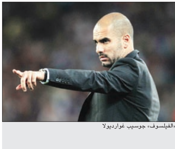
«الفيلسوف» جوسيب غوارديولا