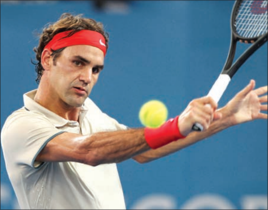
«الماسيترو» فيدرر يواصل تألقه ويبلغ نهائي دورة بريزبين

البرصية قاتلة: «تأبعت القتال برغم التراجيحات، لقد لعبت هذه خصمتي جيدا»، وتأتي هذه الدورة بمنزلة الإعداد لبطولة أستراليا المفتوحة في ملبورن والتي تنطلق منتصف الشهر الجاري.