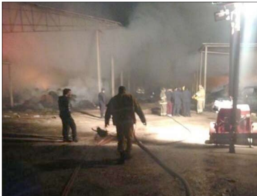
رجال الإطفاء يقومون بتمشيط المكان بعد إخماد الحريق