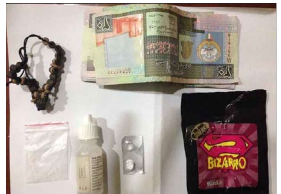
مخدرات ونقود ضبطت بحوزة المواطنين والأردني في الجابرية