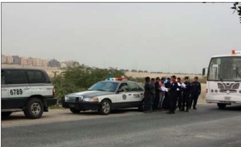
جانب من حملة أمن الجهراء أمام مدخل سكراب أمغرة

شن رجال أمن محافظة الجهراء حملة جديدة على سكراب أمغرة بقيادة المقدم مطر السبيل وتم ضبط نحو 23 وافدا مخالفا لقانون الإقامة، كما تم تحرير نحو 52 مخالفة مرورية معظمها تخص الأمن والمتانة. وقال مصدر أمني إن حملة انطلقت يوم أمس على سكراب أمغرة بتعليمات من مدير أمن الجهراء اللواء إبراهيم الطراح وقيادة المقدم السبيل وتم ضبط عدد وافدين من مختلف الجنسيات مخالفين لقانون الإقامة، كما تم ضبط وافد بحوزته كيس مملوء بمادة مخدرة وتم إحالة المتهمين إلى جهة الاختصاص. من جانب آخر فقد حرر مرور الجهراء 1527 مخالفة مرورية و84 مركبة تم حجزها عن أمر مدير مرور الجهراء العميد محمد الخالدي.