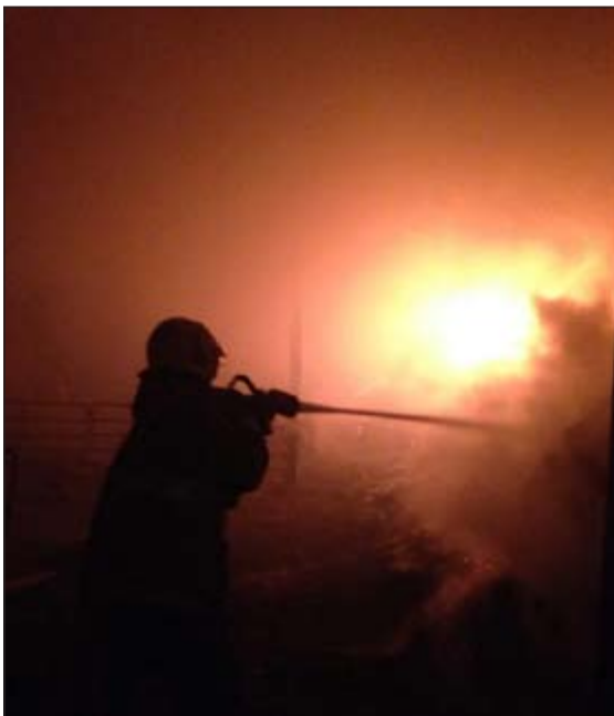
الحريق استمر نحو 4 ساعات