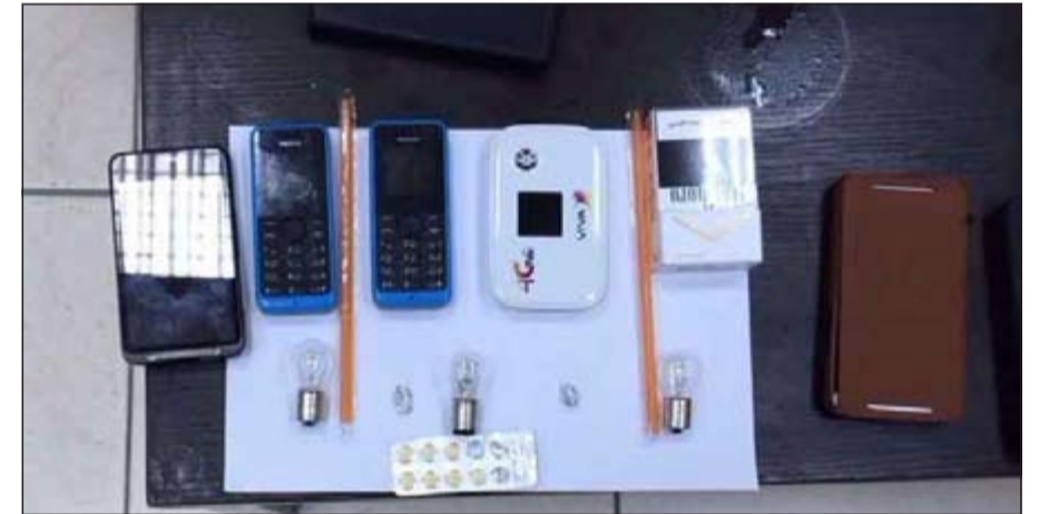
المخدرات المضبوطة بحوزة مقيم محل الإلكترونيات

المحافظة العميد غلوم حبيب بعد ضبطهم في منطقة الجابرية وبحوزتهم مواد مخدرة وأدوات تعاط. وقال مصدر أمني أن رجال دورية أمن اشتبهوا بمركبة كان داخلها ثلاثة أشخاص متوقفة بمواقف خلف إحدى البنائيات بمنطقة الجابرية، وعندما ترجل رجال الأمن وطلبوا من الأشخاص النزول من المركبة واظهار اثباتاتهم اتضح أنهم مواطنان ووافد أردني كانوا جميعهم بحالة غير طبيعية فتم تفتيشهم واحترازا ليتضح وجود كيس صغير داخله حبة بيضاء وكذلك كيس أسود بداخله مادة مخدرة وميزان حساس يستخدم لوزن المخدرات، وعليه تمت احالة المضيوظين إلى الادارة العامة لمكافحة المخدرات، ومن جانب آخر فقد قوحي عسكريان أثناء تجولهما في منطقة حولي بأصواب أحد المحلات