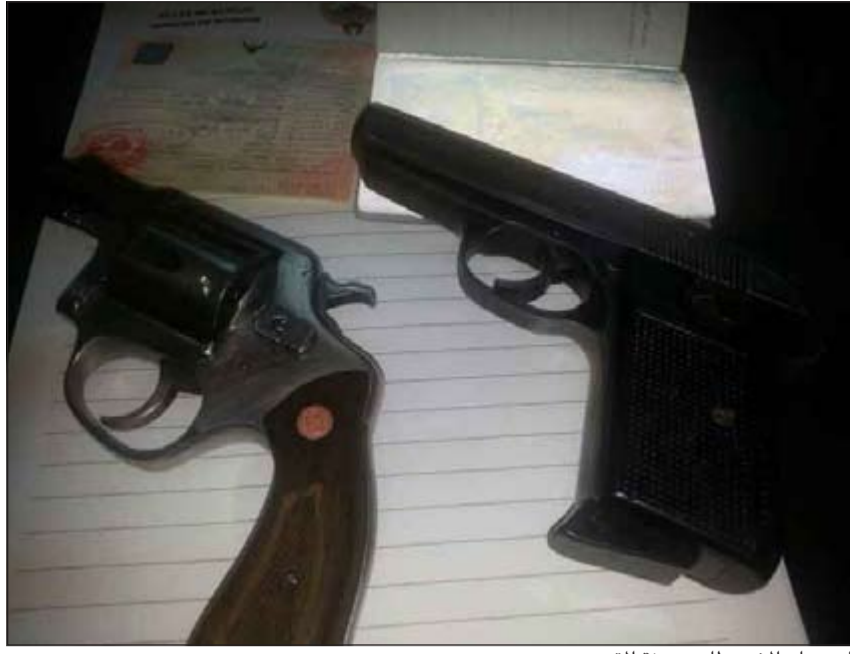
المسدسات المضبوطان بحوزة المتهم

هرب من رجال الأمن وأطلق النار في الهواء مرتين