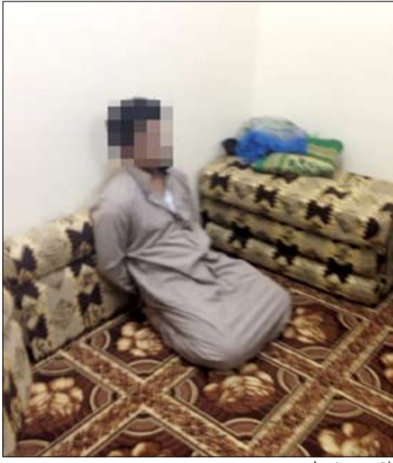
المتهم بعد ضبطه