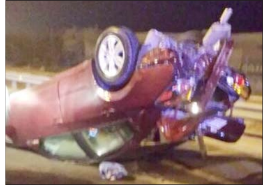
السيارة المنقلبة على طريق الملك عبدالعزيز