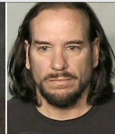
القبض على أوبري لبي برايس بعد إعلان وفاته في وقت سابق من 2012

20 ألف دولار لمن يدلي بمعلومات تساعد في القبض عليه. وواقع القضية انه هناك شكوى رفعت في المحكمة الاتحادية الأميركية ادعت أن برايس وغيره «استولى على ما يقرب من 40 مليون دولار من حوالي 115 مستثمر»، إلى جانب سوء إدارته لحسابات تلك المستثمرين. وقد وجه الاتهام لبراييس في القضية بأنه قام بتحويل أكثر من 20 مليون دولار إلى الحسابات الخاصة له والتي يسيطر عليها بصفة شخصية، إلى جانب قيامه بتزوير مكتب التحقيقات الفيدرالي وأصل البحث وإعلان عن تقديمه مكافأة تصل إلى