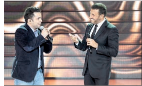
كاظم الساهر في «ستاراكاديبي»