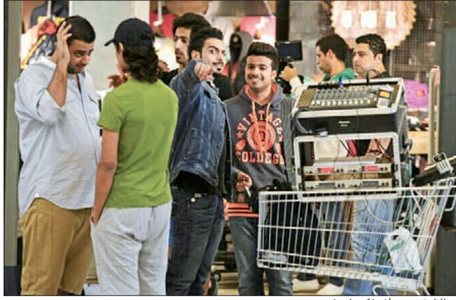
.. وأثناء تصوير "أشوفكم على خير"