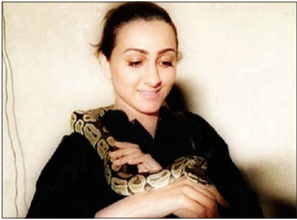
هيفاء حسين تحمل ثعباناً ضخماً

حذرتها ونبهتها من خطورة اللعب مع مثل هذه الحيوانات المفترسة. يذكر أن هيفاء وزوجها حبيب غلوم قاما الفترة القليلة الماضية بزيارة لمركز الأمل لذوي الاحتياجات الخاصة بالشارقة، وظلا يداعبان الأطفال ويلتقطان الصور معهم، ونشرت صور الزيارة على "تويتر"، وغردت "مع ذوي الاحتياجات الخاصة في ملتقى الأمل بالشارقة.. استمتعنا معاهم وادخلوا الفرحة في قلوبنا ربي يحفظهم من كل شر ويشافي كل مرضى المسلمين".