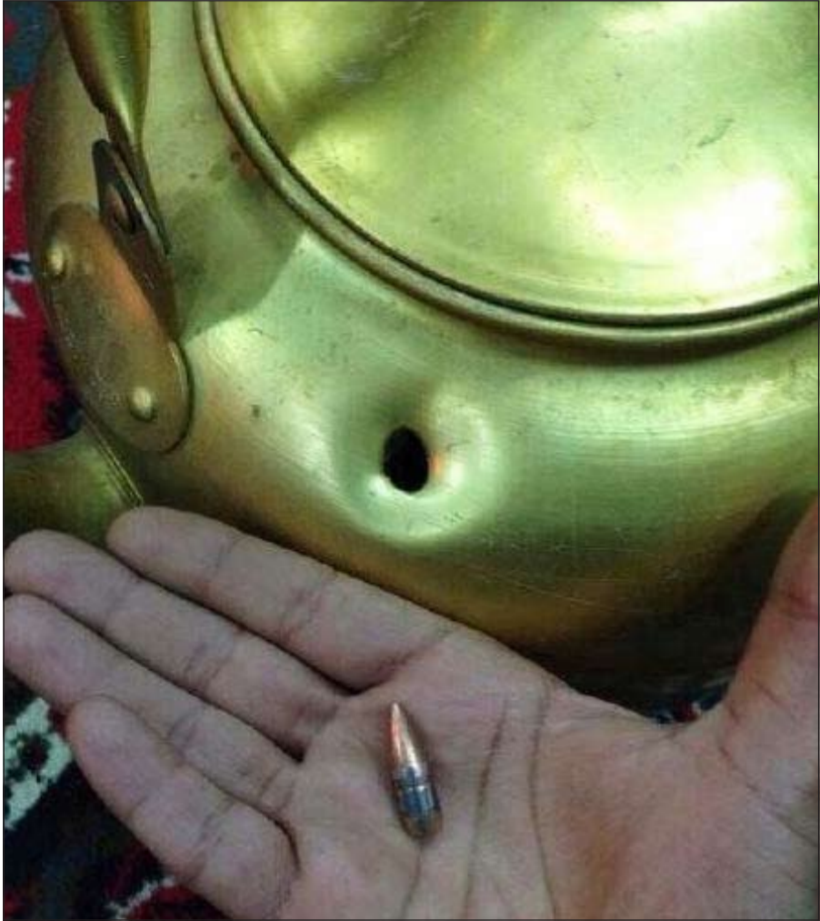
الصورة المنتشرة على مواقع التواصل الاجتماعي تبين اختراق طلقة طائشة لـ«غوري» في ديوانية مواطن

طلقة لسقف منزله أو ديوانيته، وأشار المصدر إلى أن دوريات الأمن وبحسب التعليمات الصادرة تقوم بالتوقف كإجراء احترازي في محيط أي زفاف حفل لمنع أي مظاهر مخلة بالأمن كالأستعراض أو إطلاق النيران احتفالا بالزفاف، موضحا المصدر أن من يتم ضبطه يقوم بإطلاق النار خلال أي حفل زفاف أو مناسبة سيتم حجزه وتسجيل قضية في حقه بسبب ماقلعه من خطورة كبيرة قد تصيب أشخاصا أبرياء.