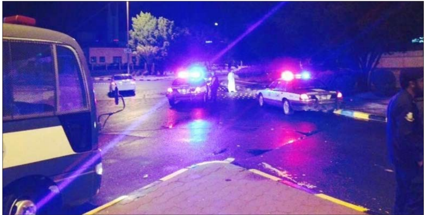
نقطة تفتيشية أقامها رجال أمن الجبراء خلال الحملة