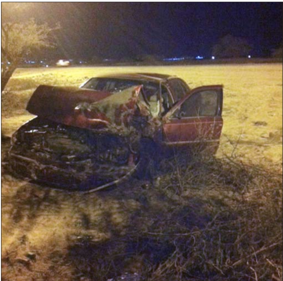
سيارة المواطن بعد انقلابها على طريق السالمي

ومن جانب آخر، فقد وقع حادث تصادم بين 3 مركبات على طريق الدائري الخامس السريع وتحديدًا بالقرب من جسر الفحيحيل وتسبب الحادث بإصابة شخصين وتم نقلهما إلى المستشفى وتعامل مع الحادث رجال النجدة ومركز إطفاء السالمية الجنوبي. وعلى صعيد متصل، نقل مواطن إلى مستشفى مبارك بعد اصطدام مركبته التي كان يقودها بعمود إنارة على الطريق السريع الفاصل بين منطقتي حولي والجابرية، ووصفت حالته بالمستقرة، وأوضح المصدر أن الحادث نتج عن انفلات عجلة القيادة من السائق ما أدى إلى انحرافها واصطدامها بأحد أعمدة الإنارة في المنطقة الفاصلة بين الشارعين.