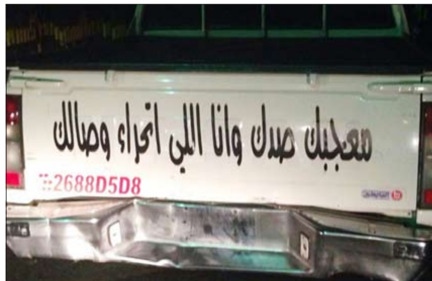
سيارة تم ضبطها خلال الحملة وإحالتها إلى الحجز

أحلت مفتشة في امن السجون وافدة من الجنسية السورية إلى التحقيق بعد ضبطها تحاول إدخال هاتف نقال إلى زوجها السجن في المركزي. وقال مصدر أمني إن إحدى مفتشات السجن