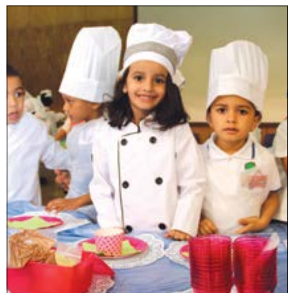
التدريب على الطبخ

الكتاب الأبيض وزودت زيبا رفيق «الشاعر والقائد» بملحق بعنوان «الكتاب الأبيض» نشرت فيه مجموعة من الصور التاريخية التي تمثل مراحل مهمة في حياة محمد جناح بالإضافة إلى حوالي 120 مقولة حرجية من أقواله لتكون مرجعا لأفكاره المحبة للسلام والمساواة وتتنوع بين الداعية إلى تحقيق الانسجام بين مختلف أطراف المجتمع، فحقا انها دعوة للمحبة والتسامح والتعايش وقبول الآخر مهما كانت ديانتته أو انتماءاته أو أفكاره.