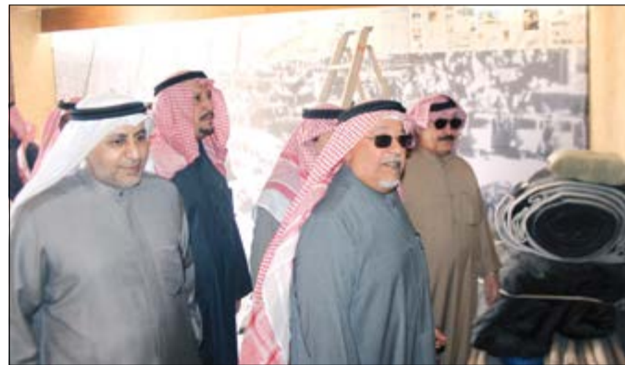
الشيخ علي الجراح خلال جولته في المتحف

لمهرجان ورئيس لجان التحكيم الشيخ صباح صبح الناصر ان اللجنة وبوجيهات من راعي المهرجان صاحب سمو الأمير رصدت 760 جائزة عينية ونقدية للفائزين بمختلف المسابقات داعيا الراغبين في المشاركة بمسابقات المهرجان