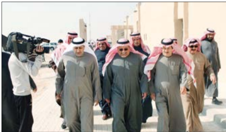
جانب من جولة الشيخ علي الجراح

وأكد ان السباقات البرية المخصصة للابل والخيل والماعز والانغام والصقور وسباقات الهجن ستقام في مقر المهرجان على طريق السالمي، بينما ستقام المسابقات البحرية في دواوين الصيادين الثلاثة في راس السالمية والبدع والوطية، في حين سيحتضن نادي الصيد والفروسية سباقات السرعة للخيل. وأوضح ان بعض المسابقات ستكون مفتوحة لكل ملاك ومربي الحلال في الكويت والخليج، بينما ستخصص بعض السباقات للكويتيين فقط وذلك لتشجيعهم على تربية هذه الحيوانات وتحسين الانتاج، مؤكدا الدور الكبير للمهرجان في زيادة اهتمام الناس وحرصهم على اقتناء أجود الأنواع من الخيل والابل والصقور وغيرها وتنمية حب تربيتها وعشقها في نفوس الأجيال لما فيها من ترويض لترافق الذي نعزّز ونفخر به.