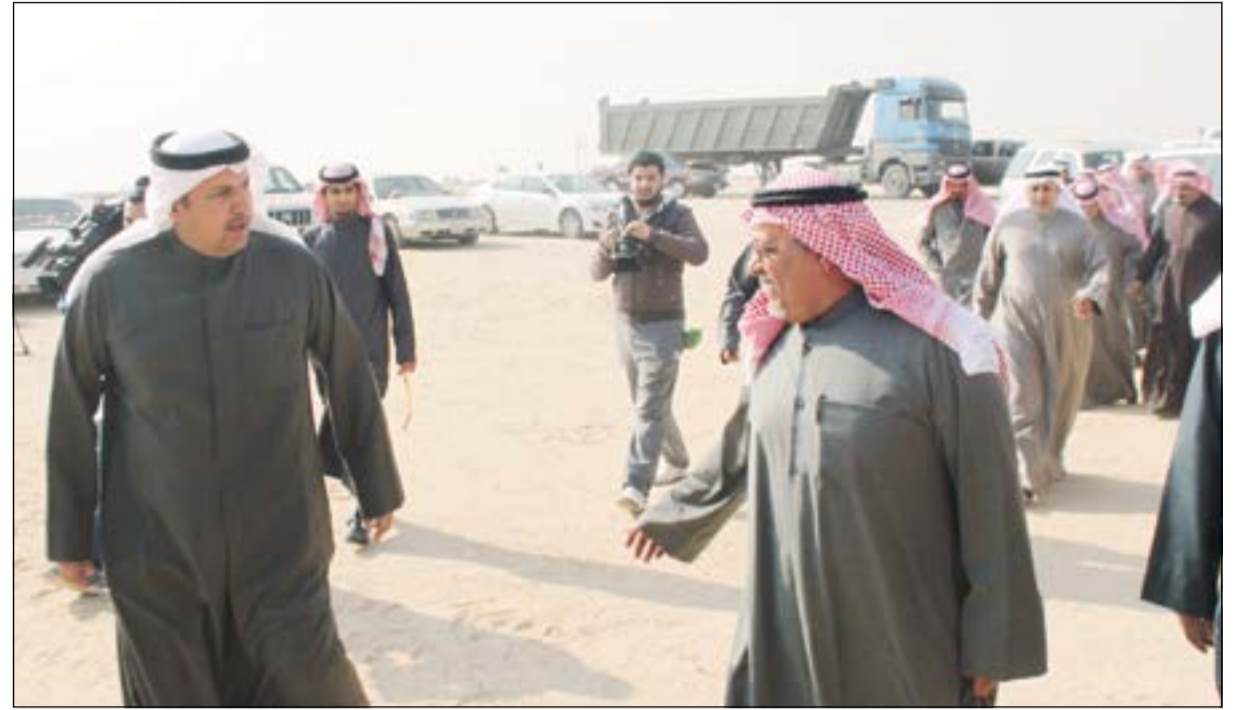
الشيخ علي الجراح متقدما أماكن المهرجان

أكد أنه سيشارك في الحفل الختامي لمهرجان مزاين الإبل في السعودية