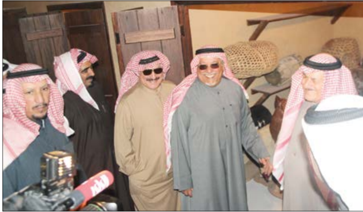
الشيخ علي الجراح في بيت العثمان

آخر الأخبار المحلية زوروا موقعنا على www.alanba.com.kw/Local