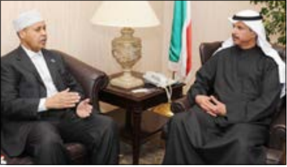
د.أحمد الأثري خلال استقباله سفير الصومال عبدالقادر أبو بكر

استقبل مدير عام الهيئة العامة للتعليم التطبيقي والتدريب د.أحمد الأثري، سفير الجمهورية الصومالية لدى الكويت عبدالقادر أمين أبو بكر مكتبته في ديوان عام الهيئة بالعديلية. وتم خلال اللقاء تناول الموضوعات ذات الاهتمام المشترك وإمكانية فتح قنوات جديدة للتعاون والتواصل بين البلدين في مجال التعليم ومناقشة أهم ما يمكن تقديمه لتطوير العملية التعليمية بين البلدين وفتح مجالات جديدة للمنتج الدراسية لطلبة الجمهورية الصومالية.