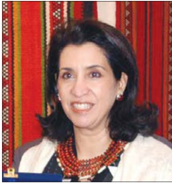
الشيخة الطاف السالم