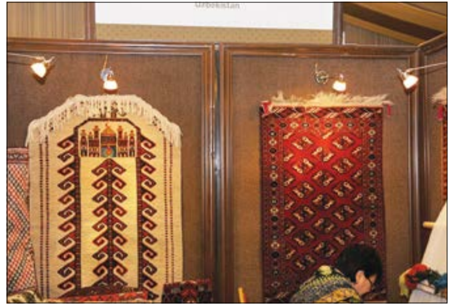
بعض العروضات في جناح سجادة الصلاة