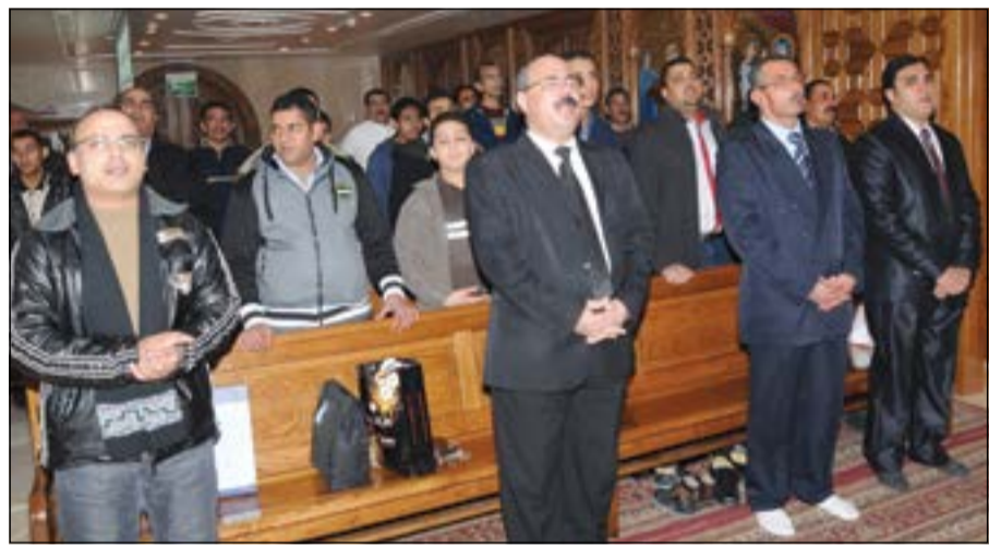
عدد من المشاركين في القداس