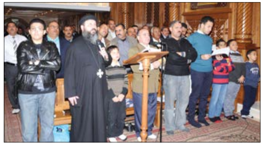
ترانيم قداس ليلة عيد الميلاد

الجميع شعائره بكل حرية فتحية للكويت وقيادتها الحكيمة وشعبها الوفي الذي لم يتوان لحظة في الوقوف الى جوار اخوانه في مصر ودعمها في كل الظروف التي مرت بها مصرنا الحبيبة.