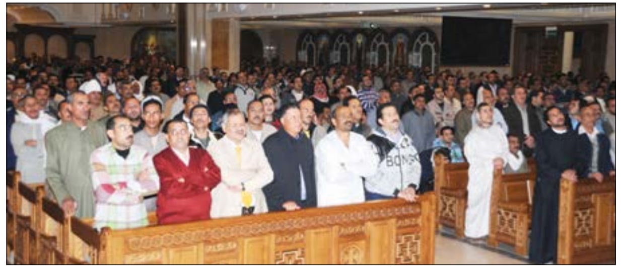
جاناب من الحضور في الكنيسة المصرية خلال قداس ليلة رأس السنة