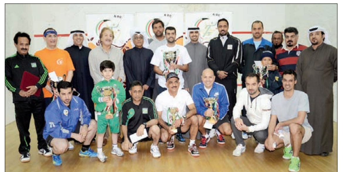
لقطة تذكارية للمشاركين بالبطولة