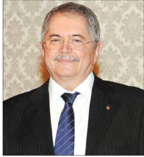
السفير الروماني فاسيلي سوفينيتي

وأشار سوفينيتي إلى أن العلاقات الرومانية - الكويتية مثال ونموذج يحتذى به لما يجب أن تكون عليه العلاقات بين الدول والشعوب والمجتمعات في عالمنا المعاصر، لافتا إلى أن تنوع هذه العلاقات وحيويتها بأعوامها الخمسين يتجسد في العديد من