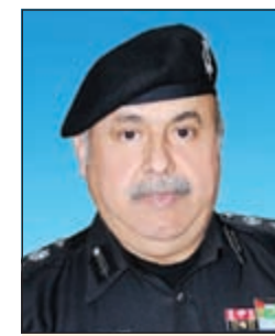
الفريق سليمان الفهد

الخالد يصدر قراراً بتكليف الفريق سليمان الفهد بأعمال وكيل «الداخلية»