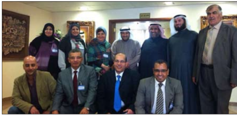
طلق الهيم متوسطا المشاركين