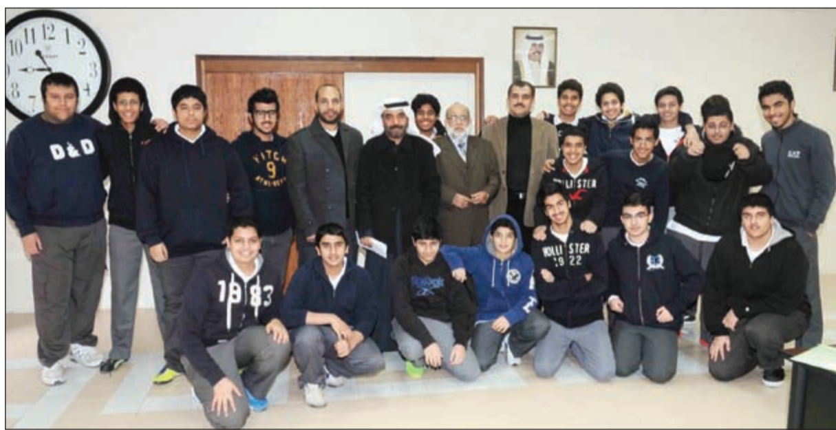
لقطة جماعية لطلاب ثانوية يوسف بن عيسى مع المدرسين