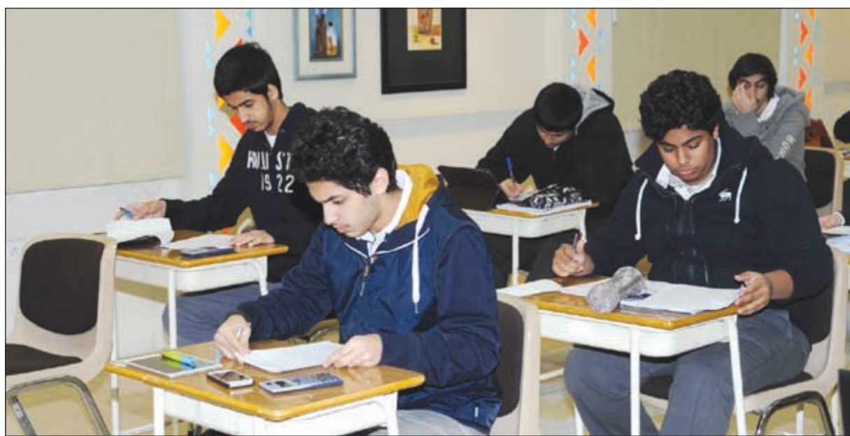
خلال فترة الاختبار